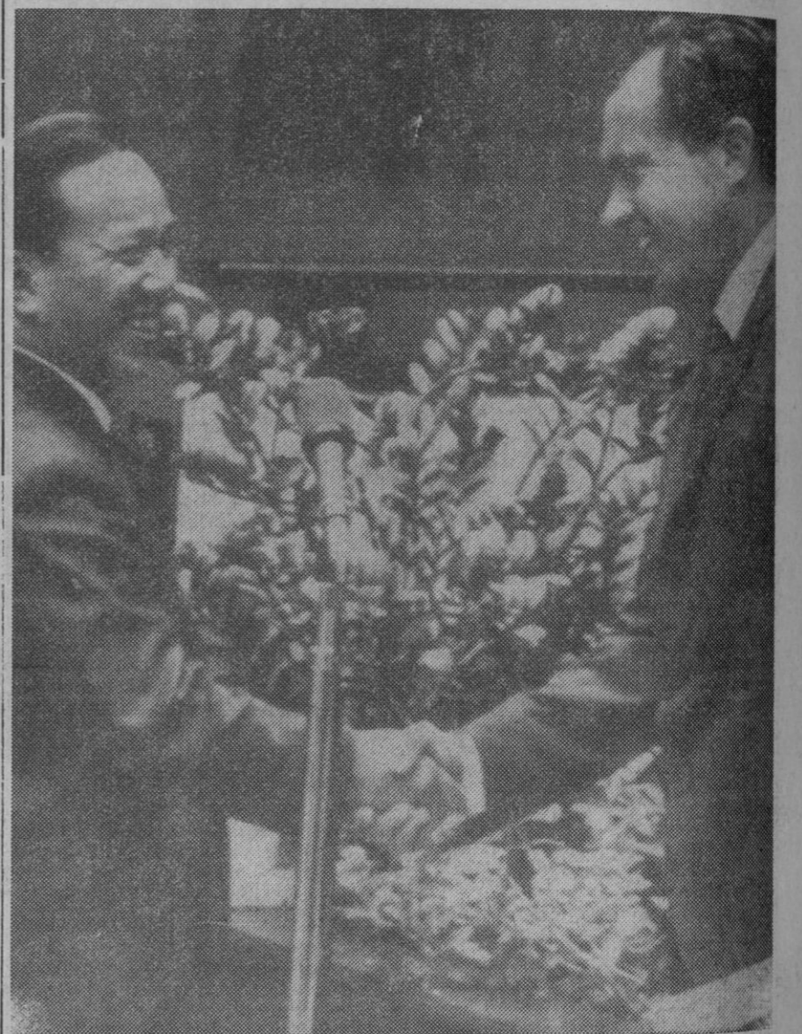
Isla de Midway.—El presidente Nixon y el survietnamita Nguyen Van Thieu han dado un comunicado conjunto tras la primera sesión de las conversaciones que ambos están realizando en la isla de Midway, en pleno océano Pacífico. Nixon está realizando la retirada de veinticinco mil soldados de sus posiciones del Vietnam.

París, 9.—Un cuadro de Chagall ha sido adjudicado en 220.000 francos en una subasta organizada en Versalles en la tarde del domingo. El Chagall es una pintura gouache, «vase de fleurs» (jarrón de flores) que pertenecía a un notario de Versalles. El nombre del comprador no ha sido comunicado. En la misma subasta se vendió un lienzo de Pissarro pintado en el año 1892 por 20.000 francos. —Efe.