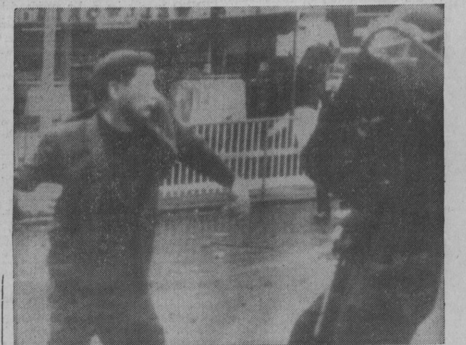
Londonderry.—En plena calle, un hombre ataca a un policía, en el transcurso de los disturbios originados en esta localidad.

No obstante, el citado portavoz no descarta la posibilidad de que en lo que falta de escrutinio puedan aparecer todavía una o varias columnas más con pleno de aciertos.—Alfil.