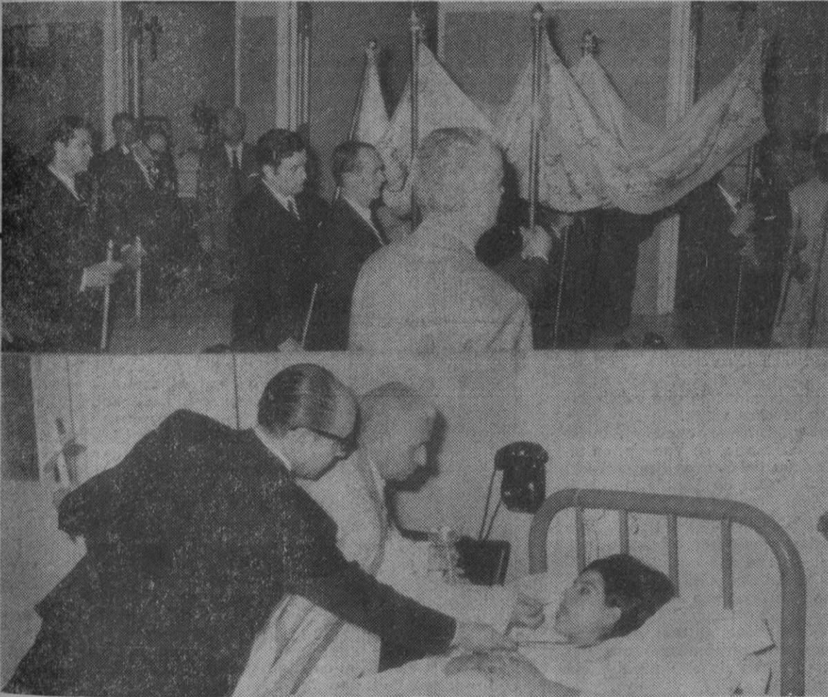
Según informamos en la sección de local, ayer tuvo lugar la comunión de los enfermos en la Policlínica '18 de Julio', acto al que asistieron el gobernador civil y otras autoridades, así como las jerarquías provinciales de la Organización Sindical. En la fotografía superior, una vista del traslado del Santísimo por las distintas habitaciones del centro sanitario, y la inferior recoge el momento de administrar la comunión a una de las señoras hospitalizadas.

El señor Silva Muñoz, después de inaugurar estas obras, hizo un amplio recorrido por todos los tramos de nueva construcción, y, más tarde, fue obsequiado con un almuerzo por la Diputación Provincial y el Ayuntamiento.