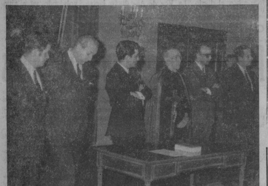
Acto de toma de posesión del nuevo delegado provincial de Trabajo, celebrado ayer en el Gobierno Civil. En la fotografía aparecen, de izquierda a derecha, el nuevo delegado, el inspector general de Servicios del Ministerio de Trabajo, el gobernador civil, el señor obispo, el presidente de la Diputación y el delegado de Trabajo saliente y recientemente nombrado de Pontevedra.