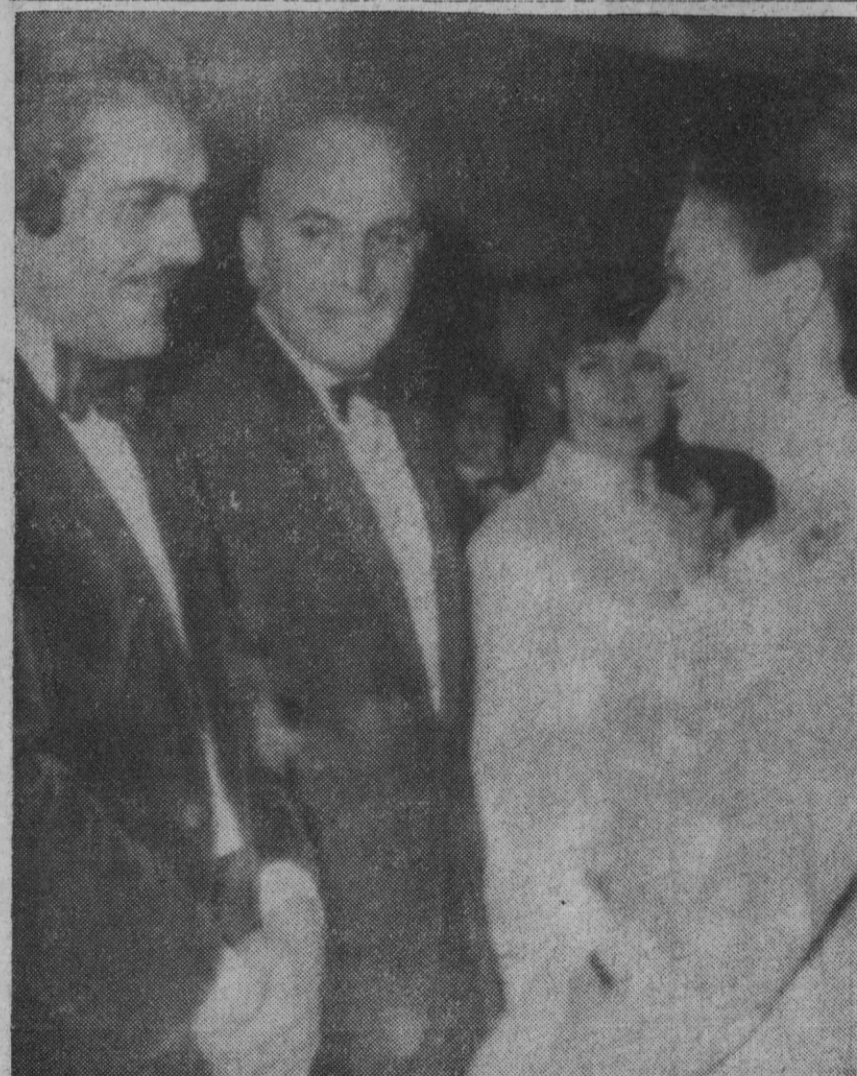
Londres.—La princesa Margarita de Inglaterra conversa con el actor egipcio Omar Sharif a su llegada al Odeón Cinema de esta ciudad, para asistir a la "premier" benéfica del último film de Sharif, "Mackenna's gold".

Madrid, 11.—Bajo la presidencia del ministro secretario general del Movimiento y delegado nacional de Sindicatos, don José Solís Ruiz, ha quedado constituido el Consejo Económico Sindical Intemporal de Extremadura, en el que se integran las provincias de Badajoz, Cáceres y Huelva.—Pyresa.