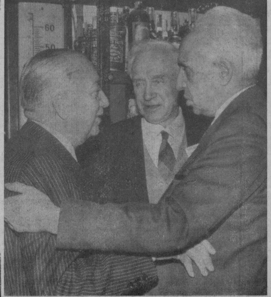
Madrid.—El profesor Severo Ochoa, Premio Nobel español, saluda efusivamente al popular "barman" madrileño Perico Chicote, en su no menos famoso museo de bebidas. Al fondo, el profesor soviético V. A. Engelhardt, asistente ambos al Congreso de Bioquímica que actualmente se celebra en esta capital.

Tokio, 11.—Una vacuna contra el cólera del cerdo, que se dice es más efectiva y económica que las que la usada actualmente, ha sido perfeccionada por el Instituto Nacional de Salud Animal del Ministerio de Agricultura y Bosques, después de dieciocho años de investigaciones.