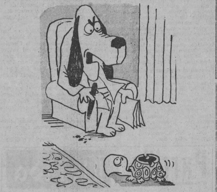
—Un cenicero bien educado viene en seguida cuando se le llama...