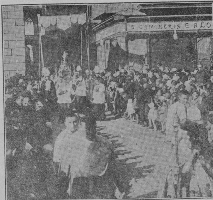
Barcelona.—La procesión de la Inmaculada celebrada el domingo último, al desembocar en la plaza de San Jaime.

5.º—El monólogo cómico titulado "En Cosme Pané", original de don José María Llavina, por B. Mulet.