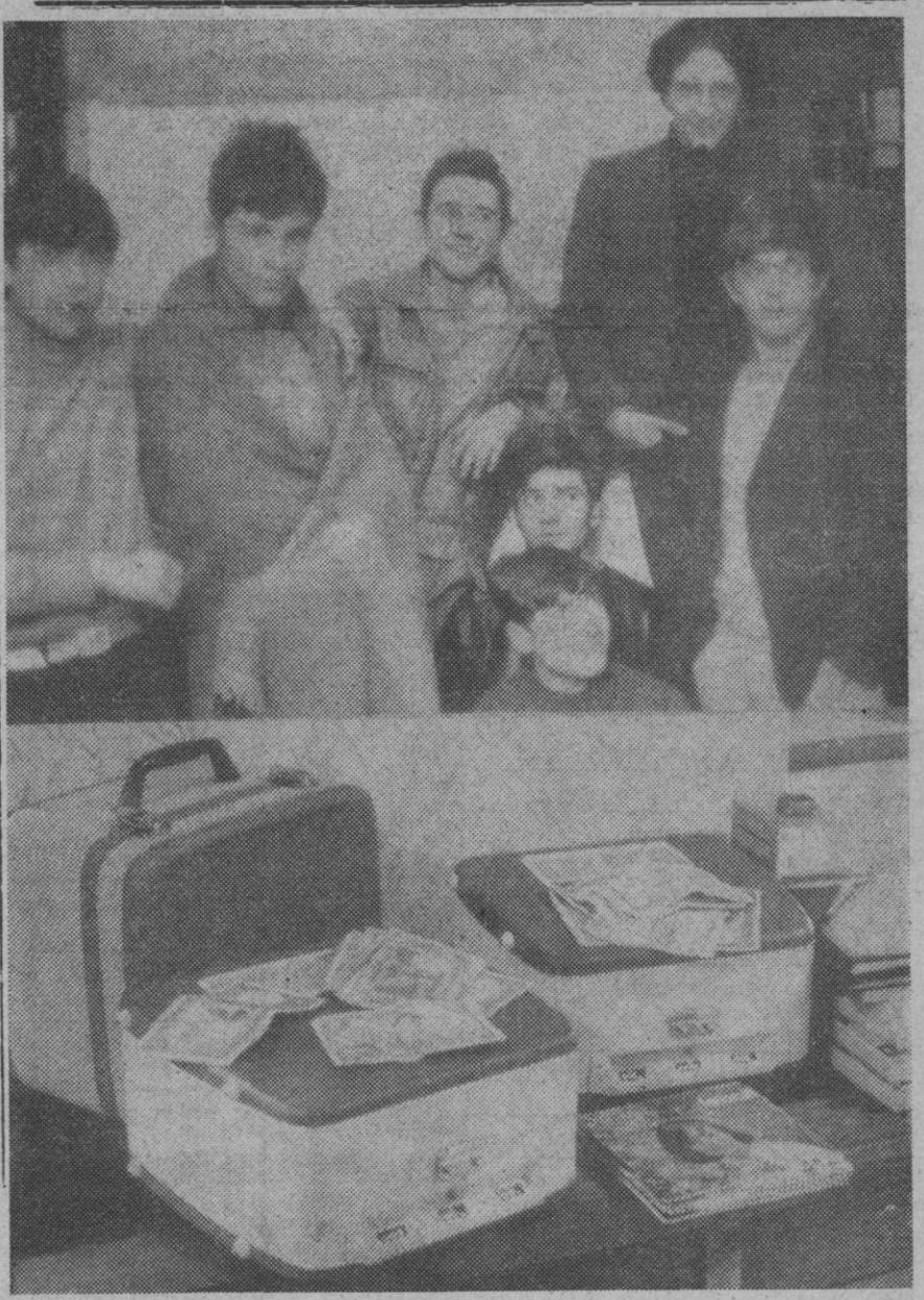
Oviedo.—Estos son los componentes (foto superior) de la banda de delincuentes juveniles desarticulada en Asturias, y que, entre otras capitales, también "actuaron" en la nuestra, según informamos en la sección local. En la otra fotografía (la inferior), parte de los objetos robados, así como del dinero que les encontró la Policía al llevarse a efecto su detención.—(Foto Europa Press)

Ciudad del Vaticano, 30.—Su Santidad el Papa visitó a última hora de la tarde de ayer, en forma privada, las grutas vaticanas y las excavaciones en el lugar donde, según la tradición, está situada la tumba de San Pedro. El Pontífice iba acompañado del arcipreste de la basílica, cardenal Paolo Marella, de monseñor Prime Príncipe, secretario de la fábrica de San Pedro y de la profesora Margherita Guarducci, la cual el año pasado concluyó una serie de estudios que llevaron a la identificación de los restos del apóstol. Pablo VI visitó detenidamente el lugar de las excavaciones y se informó del estado actual de los trabajos. Después subió a la basílica y se detuvo unos momentos en la sacristía, en una estancia donde se guarda actualmente la llamada «cátedra» —que, según tradición, es la que usó el propio San Pedro— fue sacada de su lugar habitual (la custodia de bronce que está bajo el altar de «La Gloria» de Bernini), para ser sometida a nuevos estudios a fin de comprobar su autenticidad. El Papa se informó sobre el estado de estos estudios —históricos y artísticos— que realizan técnicos de todo el mundo, comprendidos algunos protestantes. El resultado de esos estudios se espera que se haga público oficialmente.—Efe. torio de «Fotofilms S. A. E.», por su trabajo en las dos películas últimamente citadas.—Cifra.