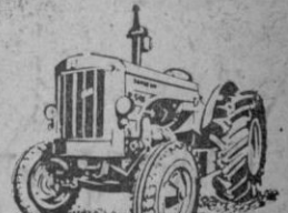
R-545 - 77 CV HMA