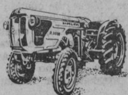
R-350 - 36 CV HMA