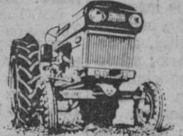
R-500 B - 52 CV HMA