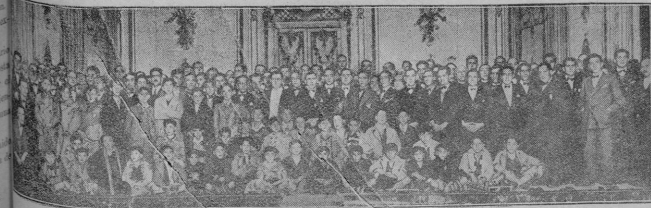
El notable orfeón vasco “Schola Cantorum”, que fué muy aplaudido en el interesantísimo concierto que dió en teatro de la Zarzuela, de Madrid, con motivo del Primer Congreso Nacional de Acción Católica.