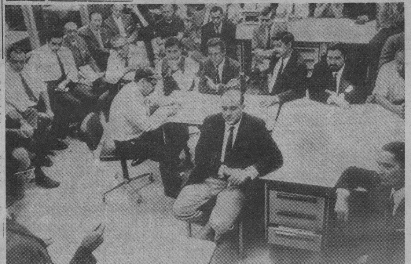
Madrid.—Reunión plenaria de los redactores de «El Alcázar» que han decidido constituirse en asociación. Se celebraron unas votaciones a fin de adoptar una postura con respecto al ofrecimiento de la Hermandad de Nuestra Señora de El Alcázar, en la que se registró un voto unánime para continuar en PESA.