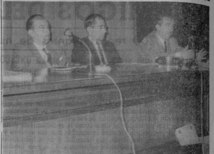
Presidencia de las reuniones.

Se han celebrado en la capital unas reuniones técnicas sobre reproducción ovina