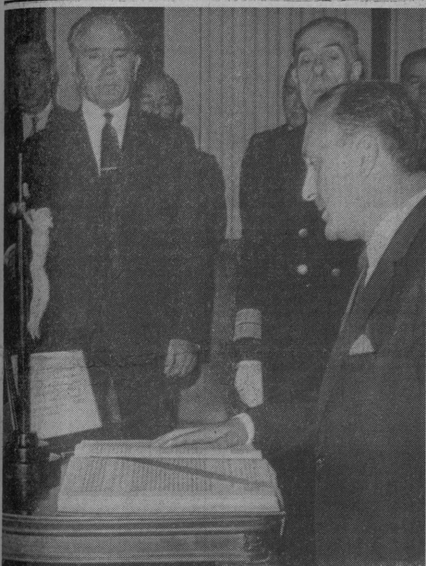
Madrid.—Don Licinio de la Fuente jura su cargo de presidente del FORPA en una de las salas del Ministerio de Agricultura. Asistieron al acto el ministro del Departamento, señor Díaz Ambrona; ministro de Comercio, señor García Monco, y ministro de Hacienda, señor Espinosa San Martín.

Barcelona, 23.—La creación de una sección circense en el seno de la Unesco, publicación de una revista internacional sobre temas de circo, crear la Federación Internacional de las Sociedades y Club de Amigos del Circo, creación de escuelas de circo en diversos países, intentar la creación de leyes nacionales de protección al circo como la recientemente dictada en Italia, mantener la pureza y ortodoxia del espectáculo circense compatible con sus avances y concretar las aspiraciones de los hombres del circo en pro de la paz mundial y de la hermandad internacional, son las bases sobre las que realizarán sus estudios los asistentes al Congreso Internacional de Amigos del Circo, que esta mañana ha sido inaugurado en Barcelona.