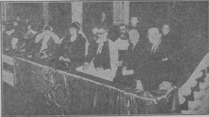
Barcelona.—Festival en el Palacio de la Música Catalana, a beneficio de las Misiones, bajo la presidencia del Rdm. Sr. Arzobispo de Verápoly, que es esperado mañana en Palma.