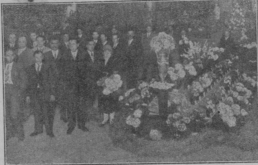
Barcelona.—Inauguración de la Exposición de flores de Otoño.

Acto seguido procedió a la lectura de los nombres de los candidatos para formar parte de la nueva Directiva, declarando reelegido al señor Presidente, que con tanto celo e interés viene cumpliendo su misión. Exteriorizada la conformidad de los concurrentes, quedó constituida la