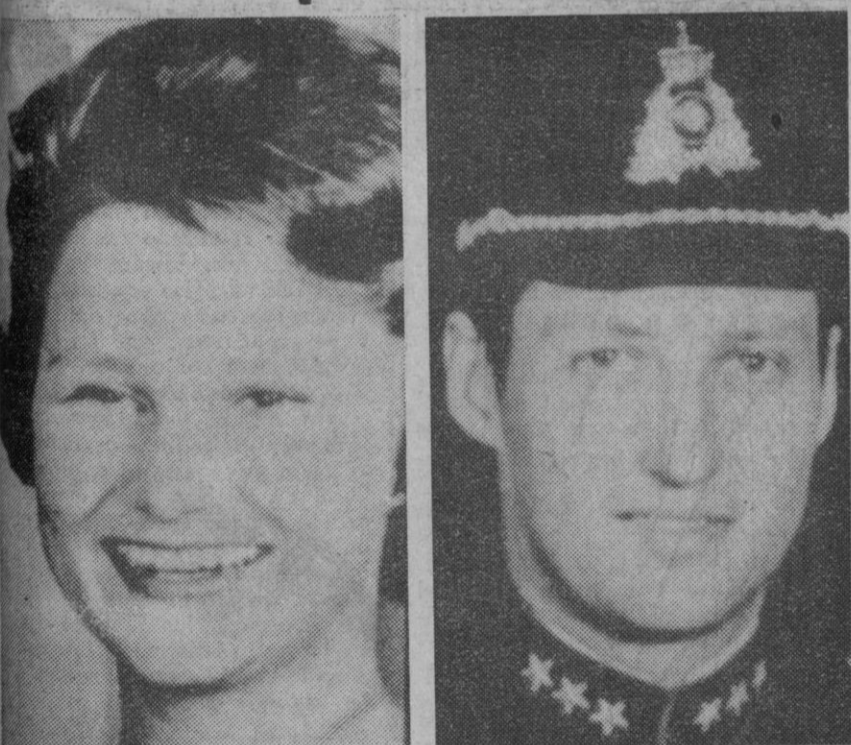
Oslo.—El príncipe heredero de Noruega, Harald, de 31 años, cuyo compromiso con su amor de los días escolares, Sonja, de 30 años, fue anunciado ayer.

Oslo (Noruega), 20.—El príncipe heredero de Noruega, Harald, y su novia, Sonja Haraldsen, celebraron la ceremonia de petición de mano, ayer por la noche, en una pequeña fiesta ofrecida por sus amigos más íntimos. Por vez primera en los nueve años que han estado unidos románticamente, Harald pudo acompañar a la rubia Sonja Haraldsen, en su automóvil oficial.