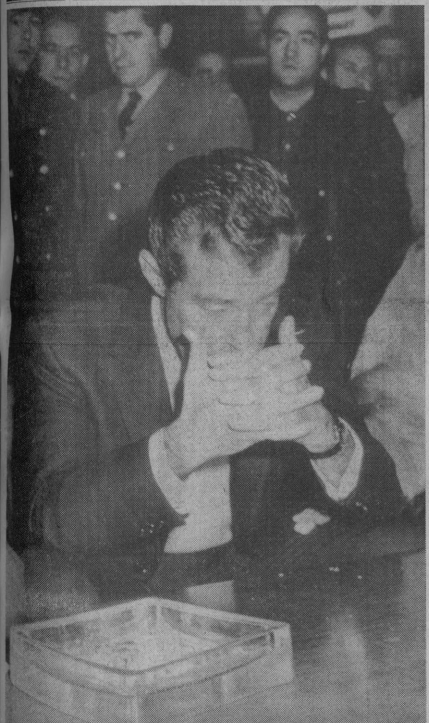
Madrid.—Jean Jacques Servant-Schreiber, autor del libro "El desafío americano" y director de "L'Express", ha llegado a Madrid, procedente de Barcelona, acompañado por varios periodistas franceses. En la foto, Servant-Schreiber poco después de bajar del avión.

Tres vagones quedaron completamente destrozados.—Efe-Reuter.