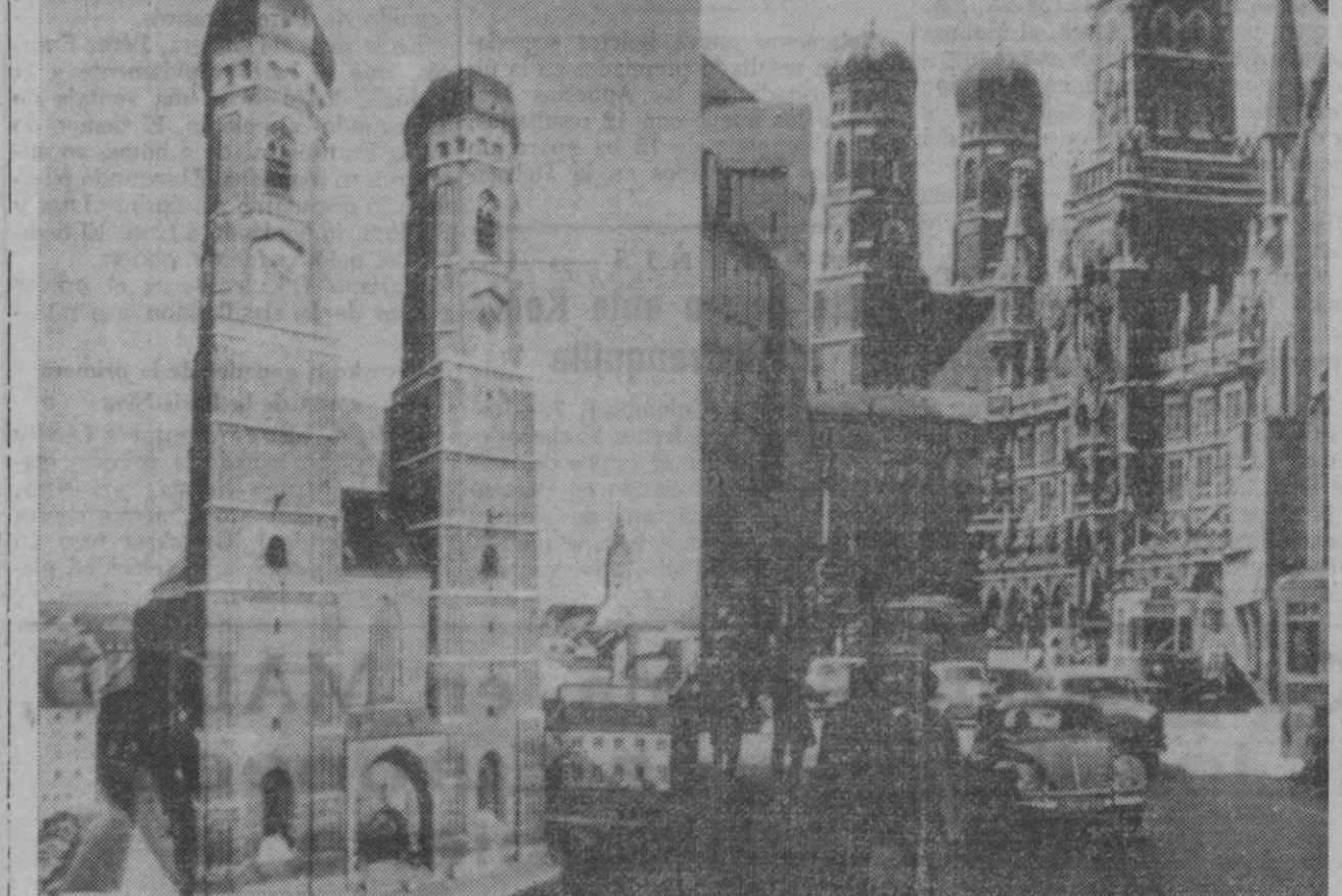
Munich.—Una rara fiesta conmemorativa se ha celebrado en Munich, la futura ciudad olímpica de la República Federal de Alemania. Acaba de cumplir quinientos años de edad su célebre iglesia de Nuestra Señora, de estilo gótico tardío. La catedral, obra maestra del arquitecto Jörg Gangofer, fue gravemente destruida durante la segunda guerra mundial, siendo terminada su reconstrucción sólo en el año mil novecientos cincuenta y siete.

Carterista capturado cuando acababa de robar un el Metro Madrid, 7.—Cuando acababa de robar una cartera que contenía 250