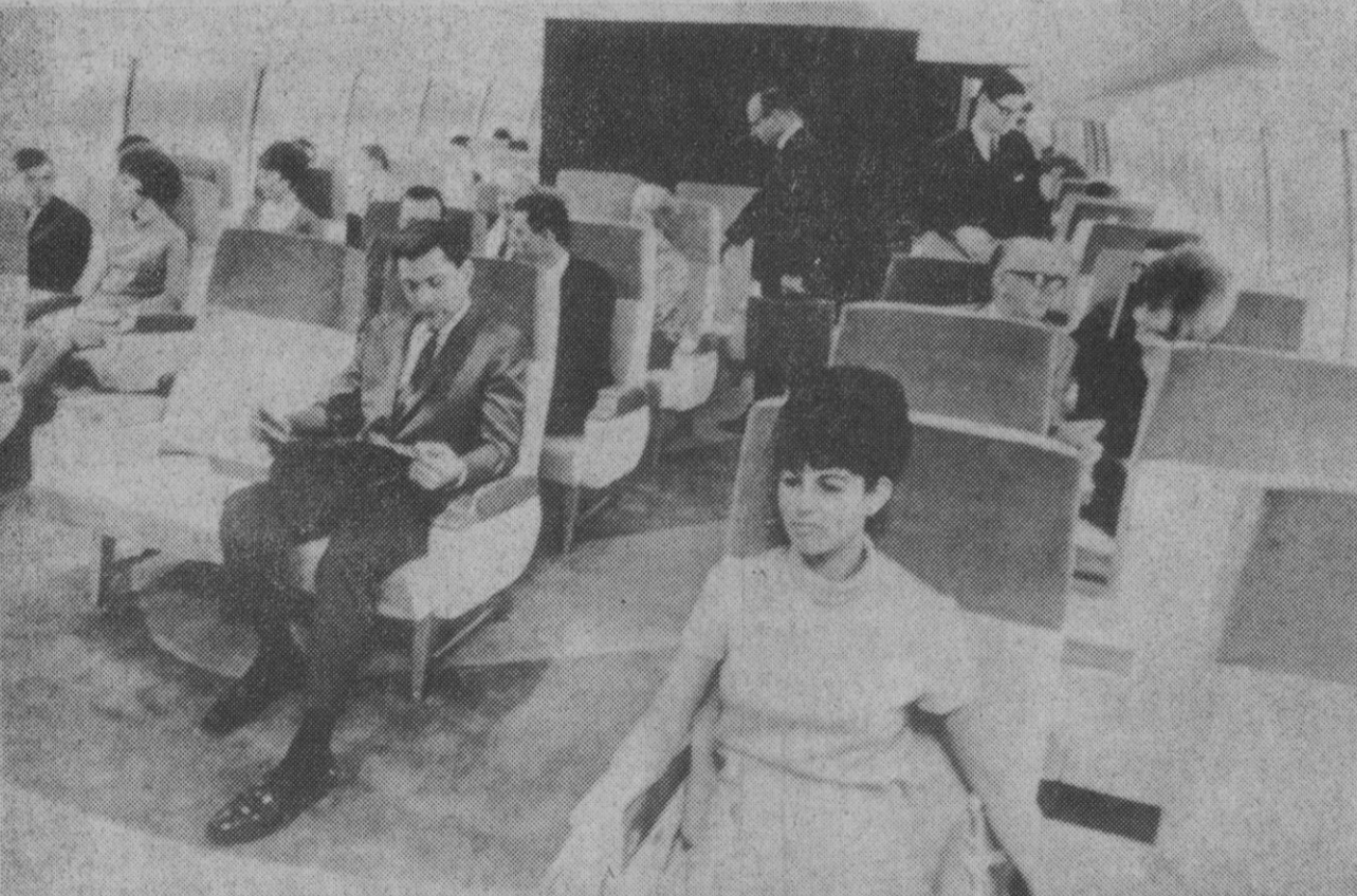
Santa Mónica (California).—La primera clase del DC-10, nuevo avión de la McDonnell Douglas, consta de asientos dobles colocados de tal modo que ningún pasajero tenga que pasar molestando a otro desde el pasillo para ocupar su puesto. La capacidad del aparato es de trescientos pasajeros en clase turista exclusivamente, y de doscientos cincuenta y dos si existe también la clase primera. El trireactor puede alcanzar una velocidad de crucero de novecientos sesenta kilómetros por hora.—(Foto Europa Press)

Madrid, 8.—Bajo la presidencia del Jefe del Estado ha comenzado esta mañana, en el Palacio de El Pardo, la reunión del Consejo de ministros. El anterior Consejo se celebró el día 23 del pasado mes de febrero.—Cifra.