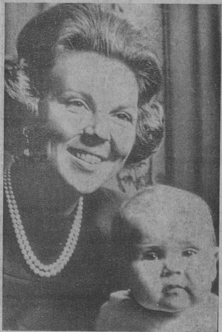
Castillo de Drakesstein (Holanda).—La princesa Beatriz de Holanda cumplirá treinta años el próximo día treinta. Con motivo de tal acontecimiento se ha hecho esta fotografía en la que aparece con su hijo, el príncipe Guillermo-Alejandro, nacido el veintisiete de abril del pasado año.

Nos hallamos haciendo esfuerzos diplomáticos. Y hemos llevado el problema al Consejo de Seguridad. Pero quiero dejar en claro que hemos tomado—y estamos tomando—ciertas medidas de precaución para estar seguros de que nuestras fuerzas militares están preparadas para cualquier contingencia que pueda presentarse en aquella zona del sureste de Asia», agregó el primer mandatario en su exposición ante el pueblo norteamericano.