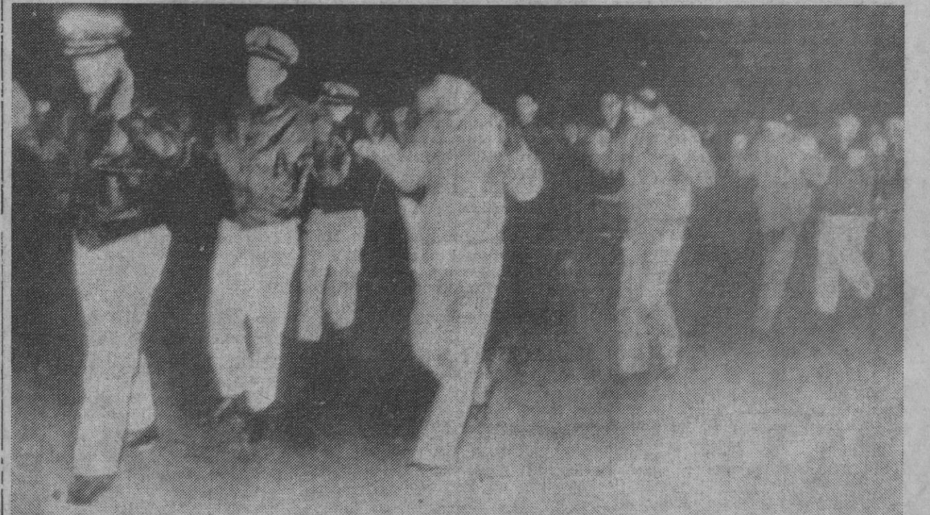
República Democrática Popular de Corea.—La tripulación del barco norteamericano "Pueblo", con los brazos en alto, desembarcados en Wonsan después de haber sido capturado el barco en aguas territoriales de Corea.

Nueva York, 27.—Las autoridades militares surcoreanas han cursado órdenes para que el primer cuerpo de ejército se mantenga en estado de alerta y listo para entrar en combate, según noticias facilitadas en círculos militares estadounidenses locales.