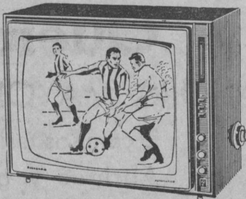
19 TE 395A

Repuestos legítimos - Servicio técnico garantizado