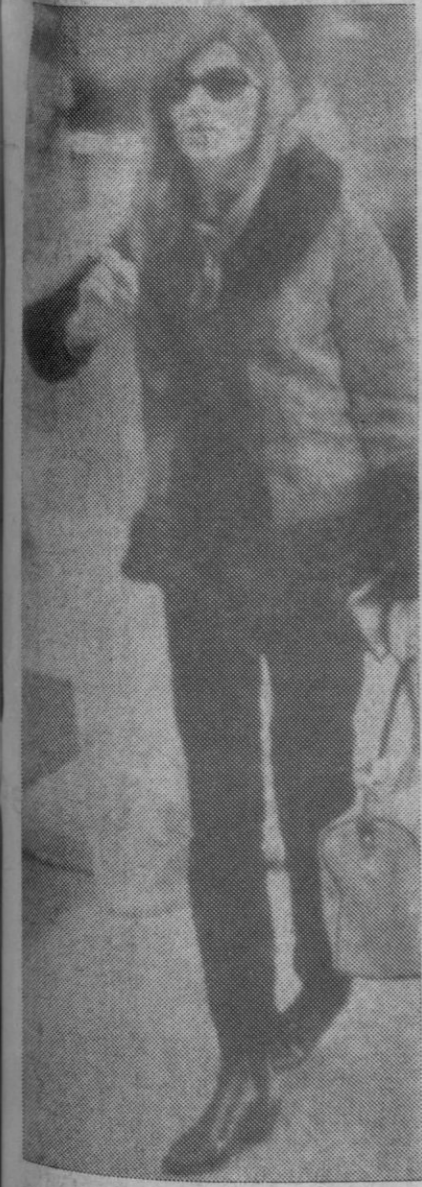
Madrid.—La cantante francesa Françoise Hardy a su llegada al aeropuerto de Barajas, procedente de París. Actuará en una gala en la capital de España.