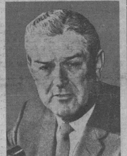
John Connally, gobernador de Tejas, a quien se considera posible sucesor de McNamara en el cargo de ministro de Defensa en los Estados Unidos

den a las medidas económicas que han de completar las ya dictadas, como consecuencia de la devaluación de la peseta, dijo que el Gobierno ha aprobado un decreto ley por el que se prorroga la vigencia de las disposiciones contenidas en la ley que aprobó el primer Plan de Desarrollo, hasta que las Cortes aprueben el segundo, disponiéndose asimismo que a la anualidad de 1967 del vigente programa de inversiones públicas le sea de aplicación lo dispuesto en el número primero del artículo 59 del reglamento de las Cortes.