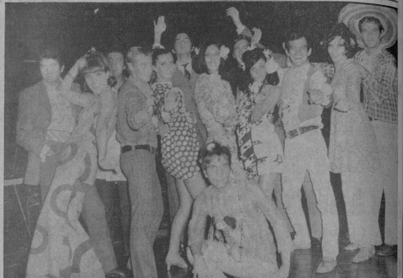
Si encuentran algún joven adornado con flores por las calles de Madrid, ¡no se asusten! se trata de un "hippie" como lo llaman en Estados Unidos o un "flower children" como lo hacen en Inglaterra.

El movimiento "hippie" empezó en América continuó en Inglaterra hasta extenderse en toda Europa y, por fin, ha llegado a Madrid. Sus símbolos son las flores. Son incon-