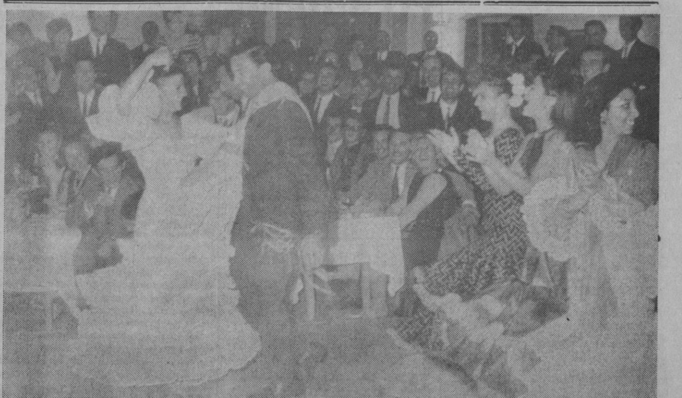
Madrid.—En un restaurante de esta capital se ha celebrado la entrega de premios a los ganadores de las pruebas del circuito del Jarama. Después actuó un cuadro flamenco, y Jim Clark, escocés, ganador del Gran Premio de España, fórmula 1, demostró que además de ser un campeón del mundo a base de jugarse la vida al volante de su "Lotus-Ford", también sabe ser alegre y simpático y hacer de "bailaor" cuando se presenta la ocasión. Y aquí le vemos demostrándolo.