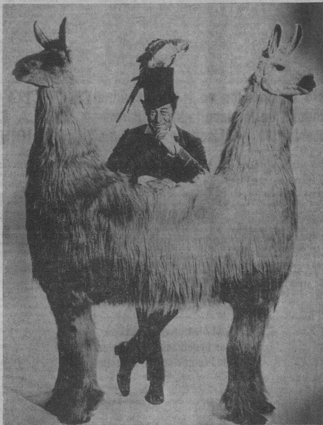
El doctor Dolittle—Rex Harrison—con un llama de dos cabezas producto del nuevo film de cienciaficción.