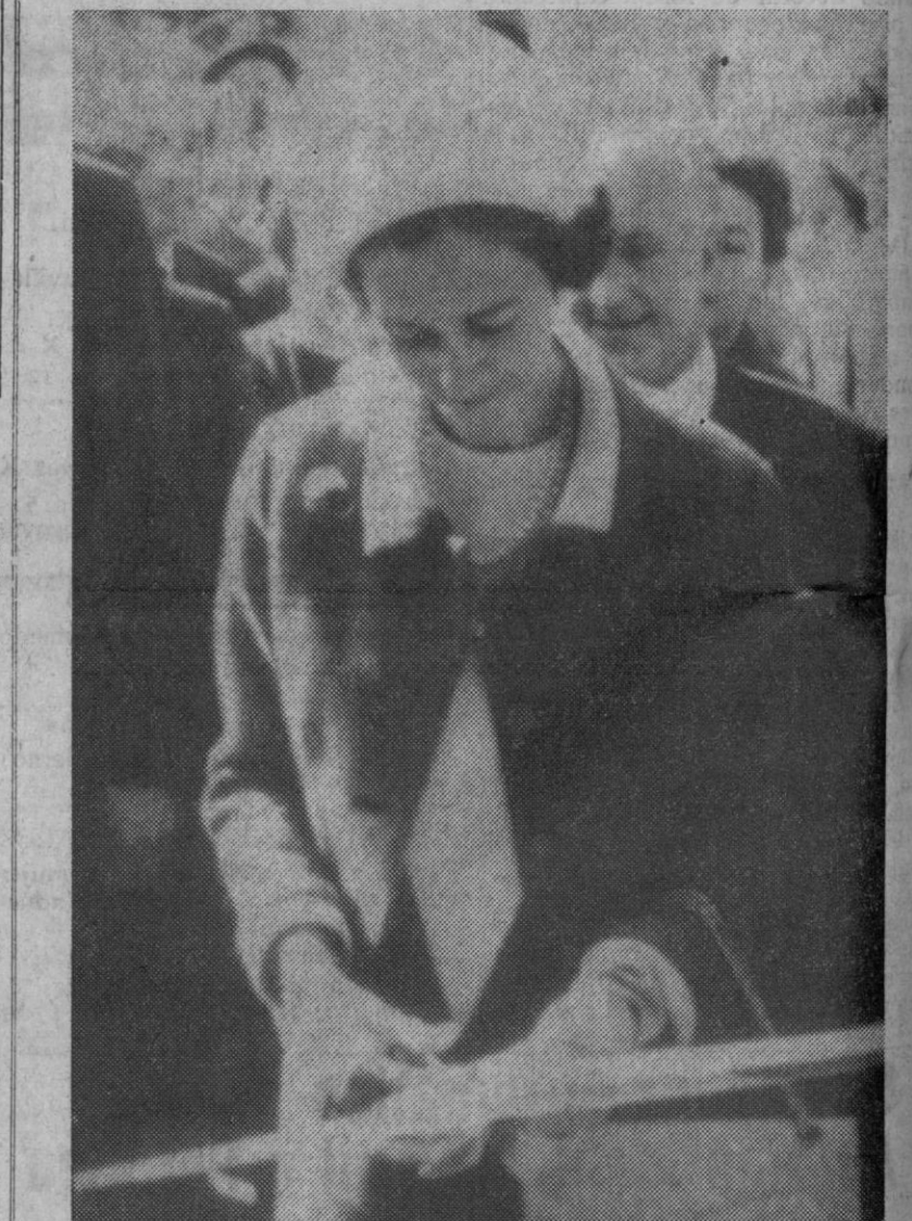
Zurich (Suiza).—La reina Fabiola de Bélgica en el momento de inaugurar oficialmente el nuevo centro "Reina Fabiola" en Leysin (Suiza).

Claire Saint Soline formó parte del jurado femenino del premio Fémina y es autora de "Reflux", "Mademoiselle Olga" y "Le Dimanche des Rampeaux", entre otras muchas novelas.—Efe.