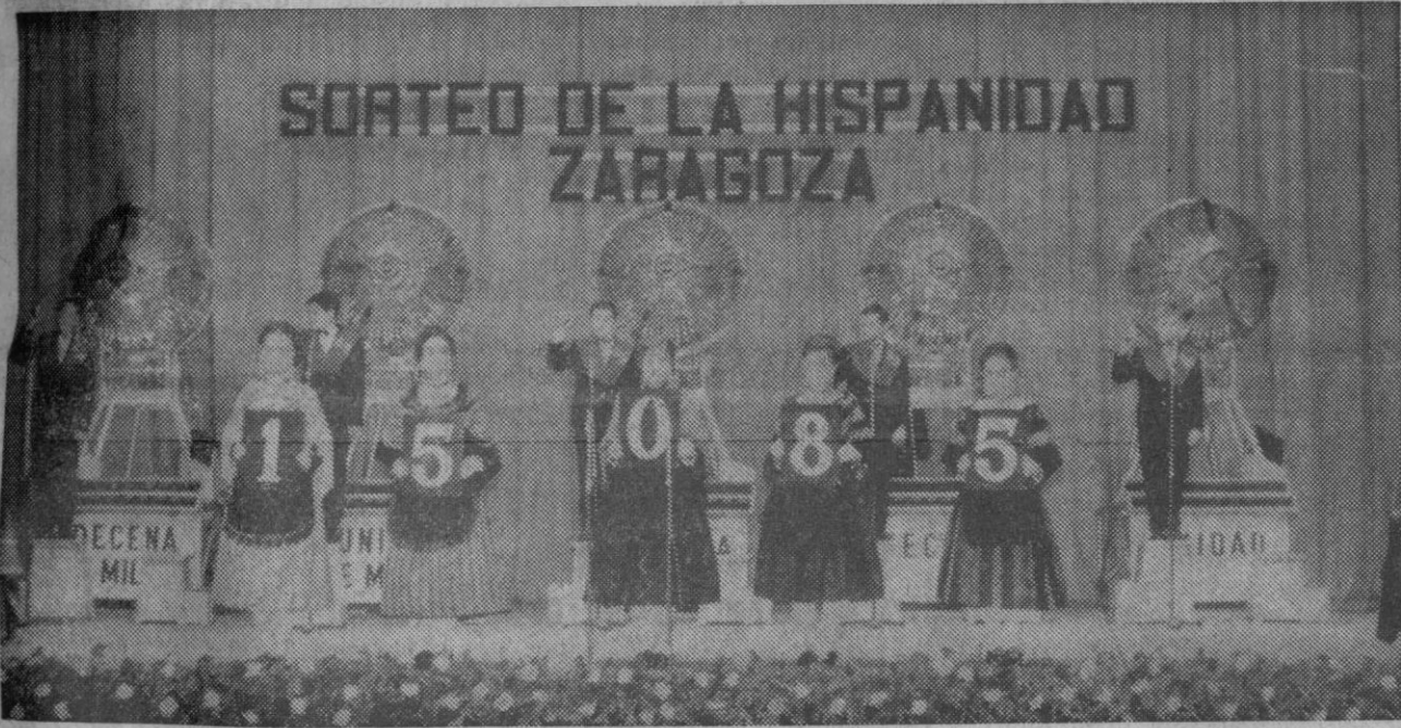
Zaragoza.—Cinco niñas ataviadas con el típico traje regional, muestran el número premiado con el «gordo» en el sorteo extraordinario de la lotería nacional que, con el nombre de «Sorteo de la Hispanidad», se ha celebrado ayer en Zaragoza, y que ha correspondido, en su cuantía más importante, a nuestra ciudad.

La experiencia tuvo lugar mientras en San Juan se celebra la conferencia anual de las Asociaciones Interamericanas de Prensa.—Efe.