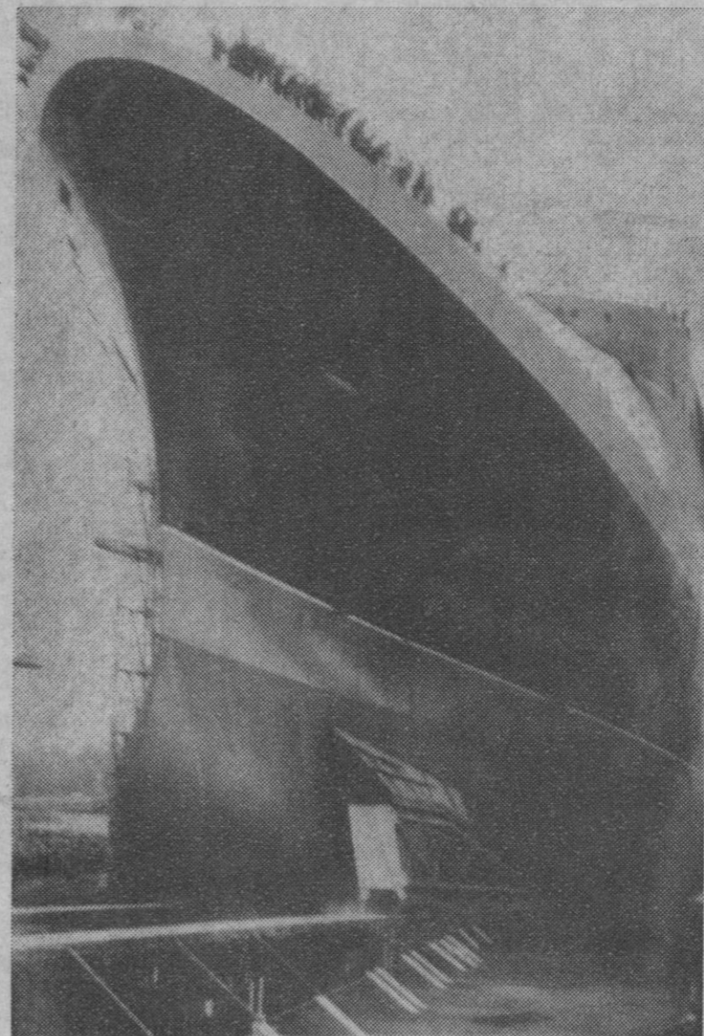
Clydebank.—Momento en que el nuevo paquebote "Queen Elizabeth II" se desliza por las gradas hasta el agua, durante su botadura en River Clyde, en presencia de Isabel II

Entre Ríos (Argentina), 21.—Un 35 por ciento de las viviendas de la localidad de Conscripto Bernardi, de esta provincia, acusan serios deterioros a causa de un fenómeno extraño, que por lo poco común causó pánico en algunos pobladores. Piedras de extraordinario volumen en algunos casos, que alcanzaron el tamaño de un ladrillo, cayeron, luego de una fuerte lluvia, acompañada de ráfagas de hasta cien kilómetros. Salvo los grandes daños materiales, no hubo ninguna víctima que lamentar.—Efe.