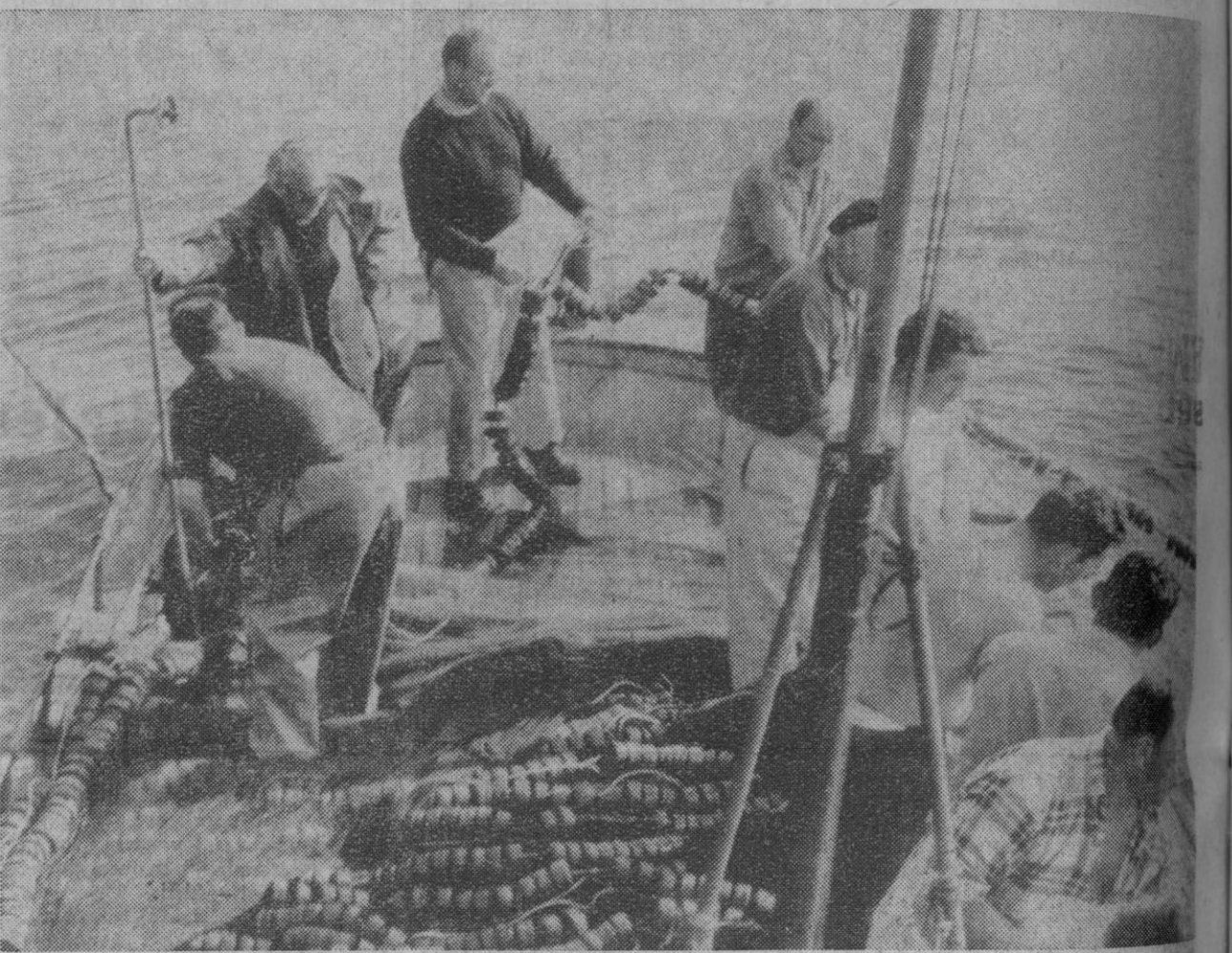
Cariño (La Coruña).—El ministro de Información y Turismo, señor Fraga Iribarne, como un pescador más, colabora en las faenas de pesca, alando el aparejo, en ocasión de un lance, durante su visita a Cariño.

A esta peregrinación gitana asisten prelados de diversos países que encabezan las representaciones nacionales.