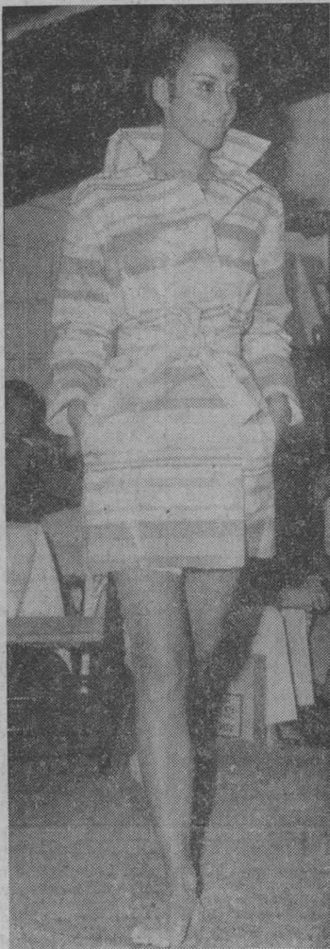
Vestidos de papel, moda 1967.

Hay también quien opina que los nazis al marcar a las muchachas israelitas con la estre-