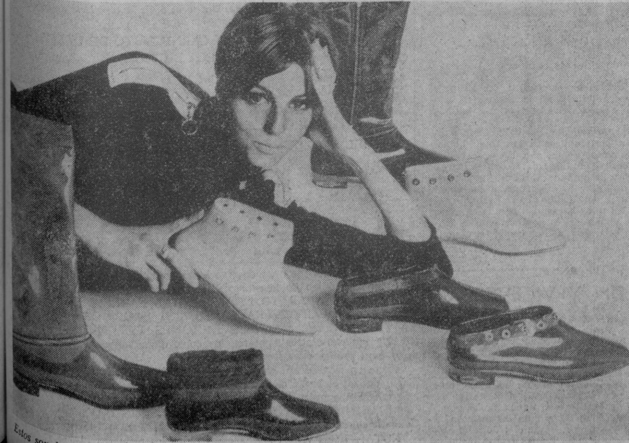
Estos son los zapatos-botas, lanzados al mercado en Inglaterra, de material de plástico.

No aconsejamos adoptarla violentamente, sino acortarla por lo menos a la altura de la rodilla. No se puede volver a los 16 años, pero tampoco es necesario oponerse rotundamente a una moda que es juvenil y graciosa.