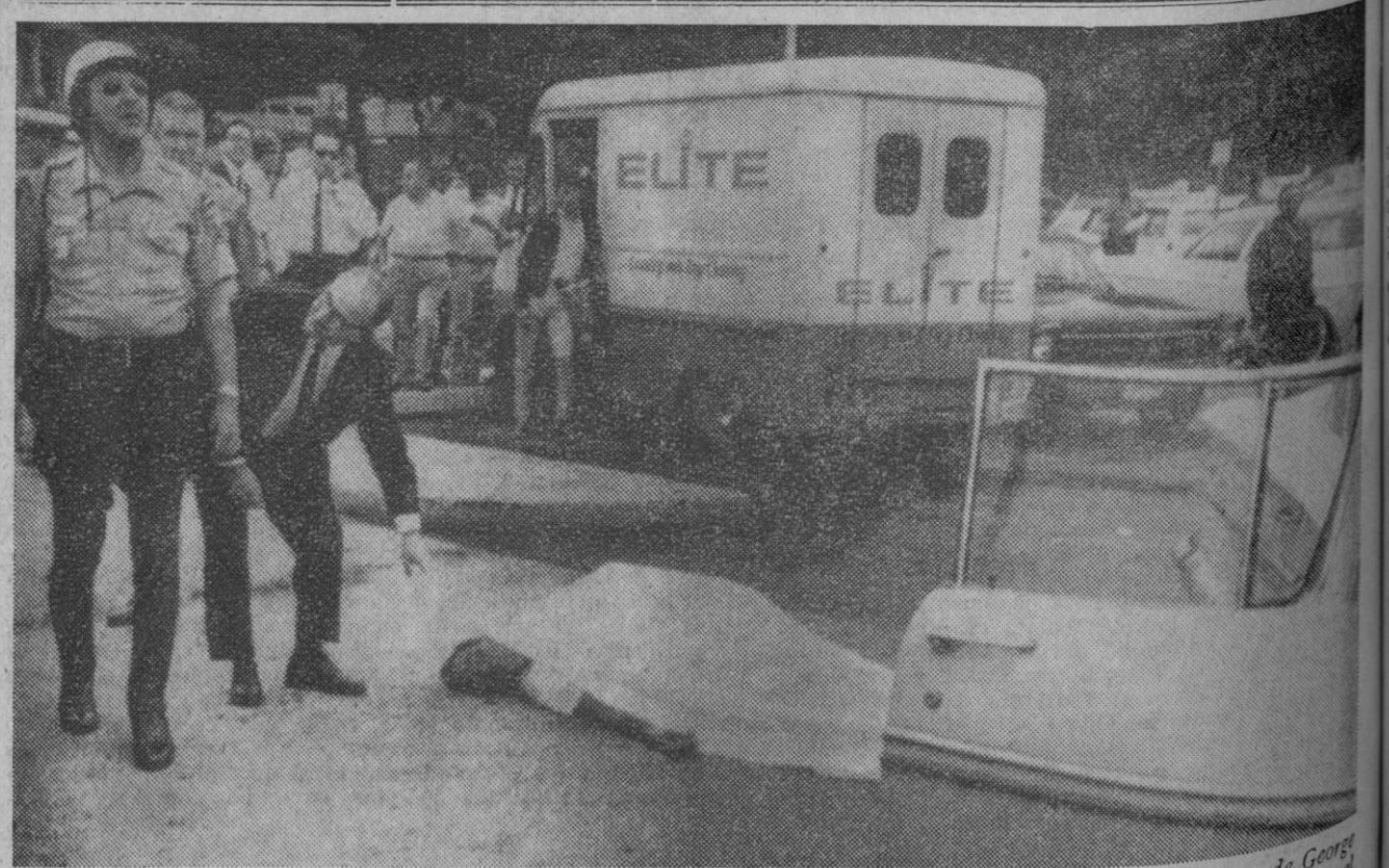
Arlington (Virginia).—Un policía aparece junto al hombre que quita la sábana que cubre el cadáver de George Lincoln Rockwell, jefe del partido nazi americano, después de ser abatido a tiros por un francotirador en el centro comercial de la localidad. Rockwell fue muerto cuando se iba a sentar en su coche, derecha, al salir de una lavandería automática.