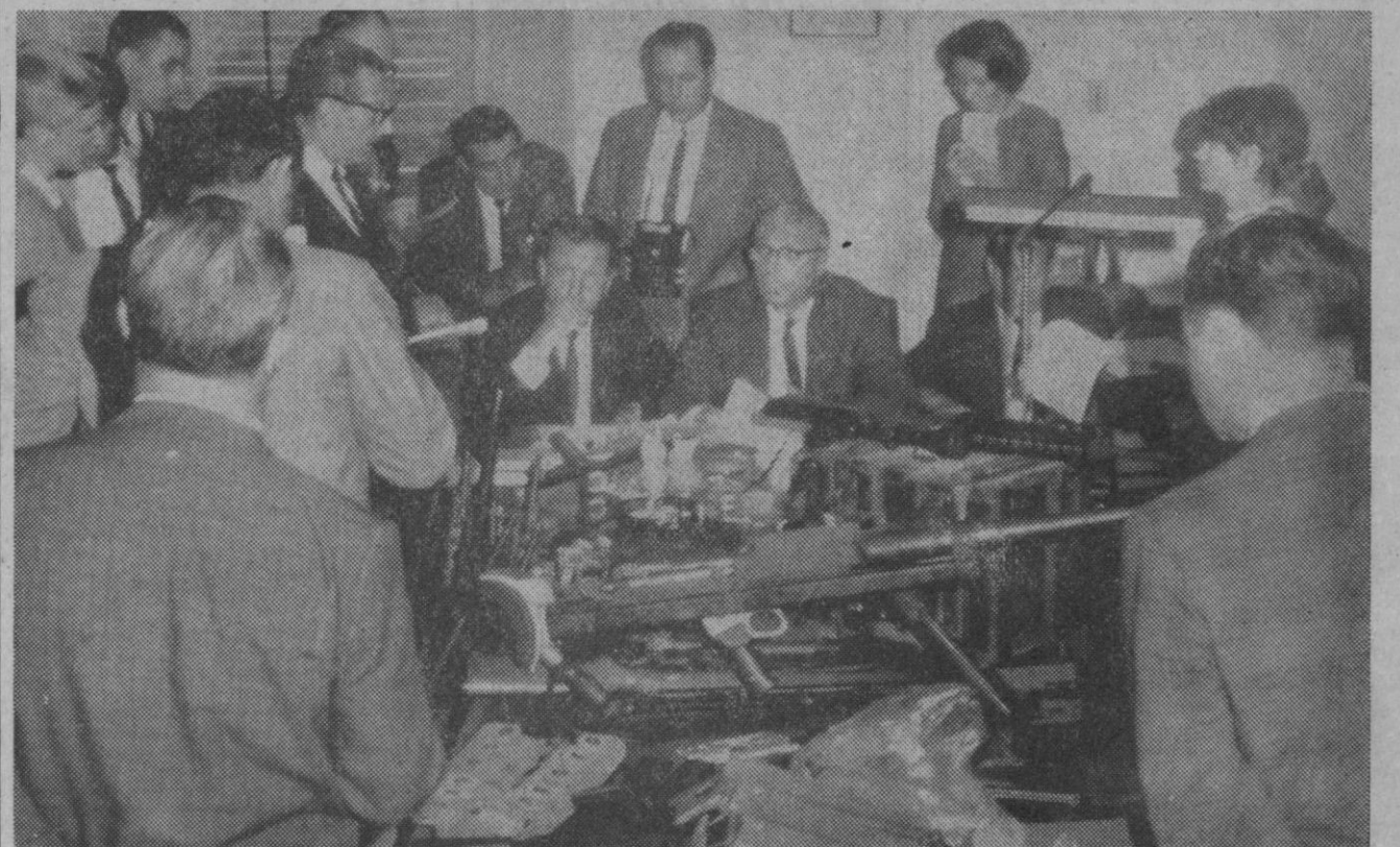
Nueva York.—Los periodistas contemplan parte de un arsenal recogido en registros policiales en el Bronx y algunos establecimientos. Cuatro hombres descritos por la Policía como «derechistas» fueron arrestados. El fiscal Isidore Dollinger, al centro al fondo, contesta las preguntas de los periodistas.

23.036.-Alcoy, Alicante, Vigo, Santiago, Sevilla, Bilbao, Granollers y Madrid.—Cifra.