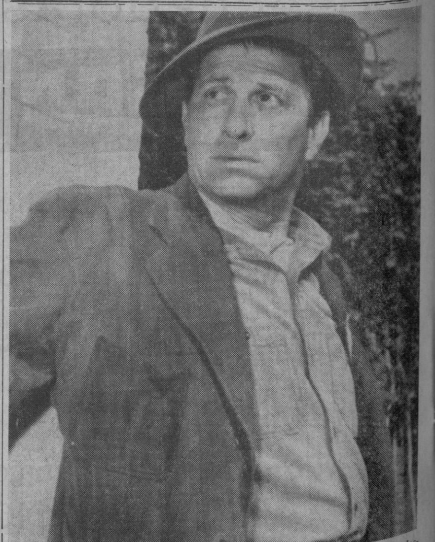
Nueva York.—Fotografía del hombre manco que mató a la esposa del doctor Kimble en la serie de televisión «El Fugitivo».

La economía se interesa particularmente por este hongo extraordinario. La investigadora tiene otros planes. Quiere obtener un hongo más compacto y por ende más pesado. Por otro lado, los núcleos celulares—que cobijan el sistema hereditario—deben ser aislados totalmente, para asegurar el tamaño y contornos del nuevo champiñón. Espera que para dentro de tres años habrá logrado cuajar su filete vegetariano.