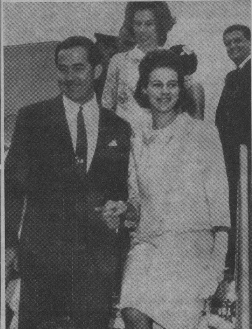
Nueva York.—El rey Constantino y la reina Ana María aparecen al bajar del aparato que les ha llevado a Nueva York, camino de Montreal.

Y utilizó a los jóvenes que cursan estudios en el Instituto de Lenguas Extranjeras