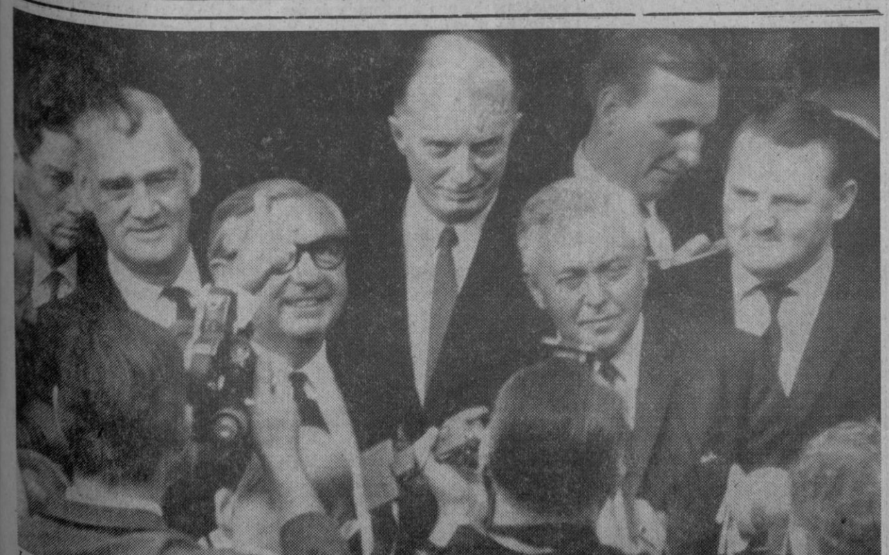
Londres.—El secretario del Exterior británico hace con el dedo una señal de que todo está bien, mientras sale del aeropuerto con el primer ministro Wilson, con el que se ha entrevistado con carácter de urgencia para estudiar la situación tras el asalto y la destrucción de la Embajada británica en Pekín.

Círculo por la derecha. Con ello contribuirá Vd. a que reine en la carretera un clima de cordialidad y respeto