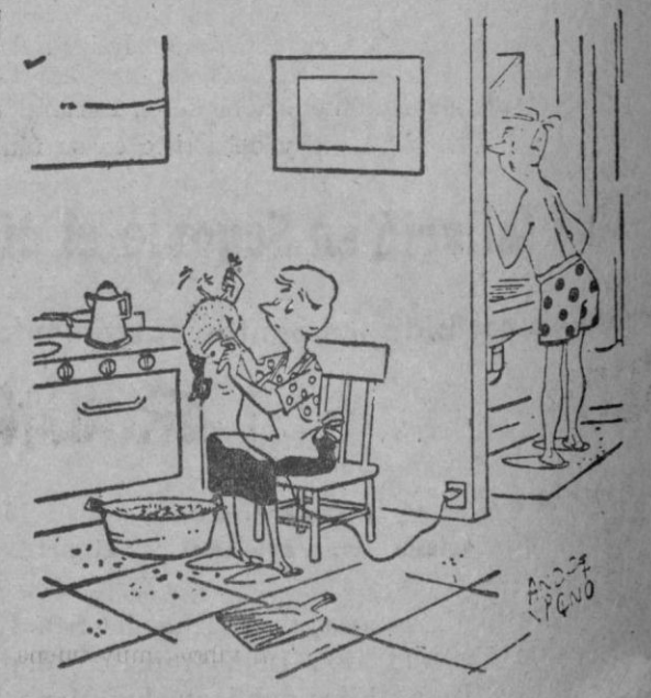
—¿Has visto mi máquina eléctrica de afeitar?