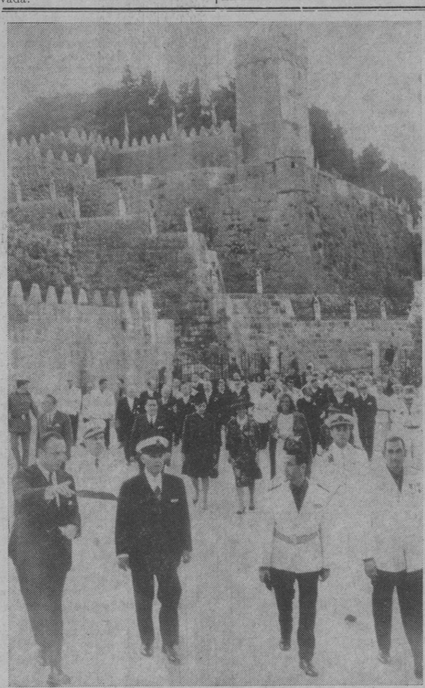
Bayona (Vigo).—El Jefe del Estado, acompañado de su esposa y del ministro de Información y Turismo, recorre las instalaciones del parador de turismo Conde de Gondomar, fortaleza antigua destinada ahora a ser útil en la paz.

Sobre este punto se elabora un ambicioso plan de colaboración entre el Ministerio y la iniciativa privada.