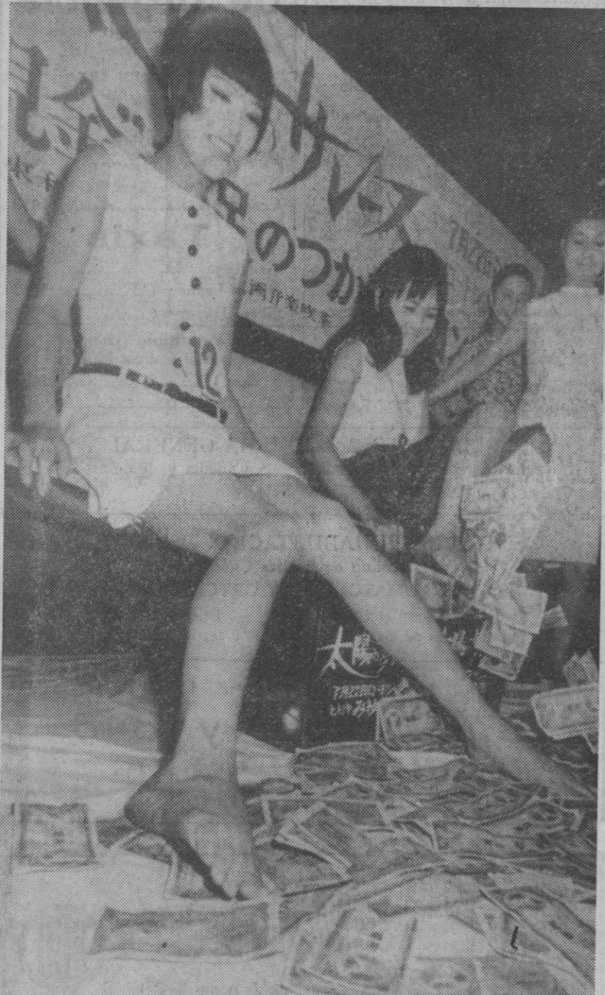
Tokio.—Chicas en minifalda recogen del suelo de un club nocturno todo el dinero que pueden abarcar en una sola vez con los pies. Se trata de un concurso de publicidad. Tomaron parte veinticuatro muchachas, y la ganadora recogió ciento veintidós mil «yen» en los treinta segundos de tiempo límite.

El accidente fue motivado al detenerse bruscamente el caballo que montaba Omar y dar «un salto de caramelo», que hizo que el actor saliera del pedido por las orejas sufriendo la fractura mencionada y algunas contusiones.