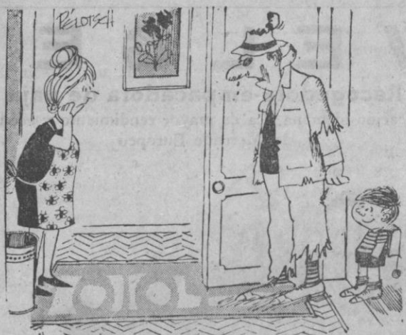
—Si no hubiera estado allí para separarles, todavía estaría pegándose con todos los chicos del barrio...

Pida BUTANO a los teléfonos 14-66 16-82 16-25 CASA SOLERA