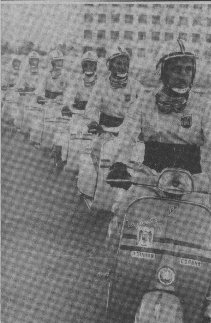
Madrid.—Presentación de parte de los corredores que en moto Vespa participarán en el Rallye Madrid-Moscú, que ayer se inició desde la capital de España. La presentación ha sido efectuada en la Delegación Nacional de Educación Física y Deportes.