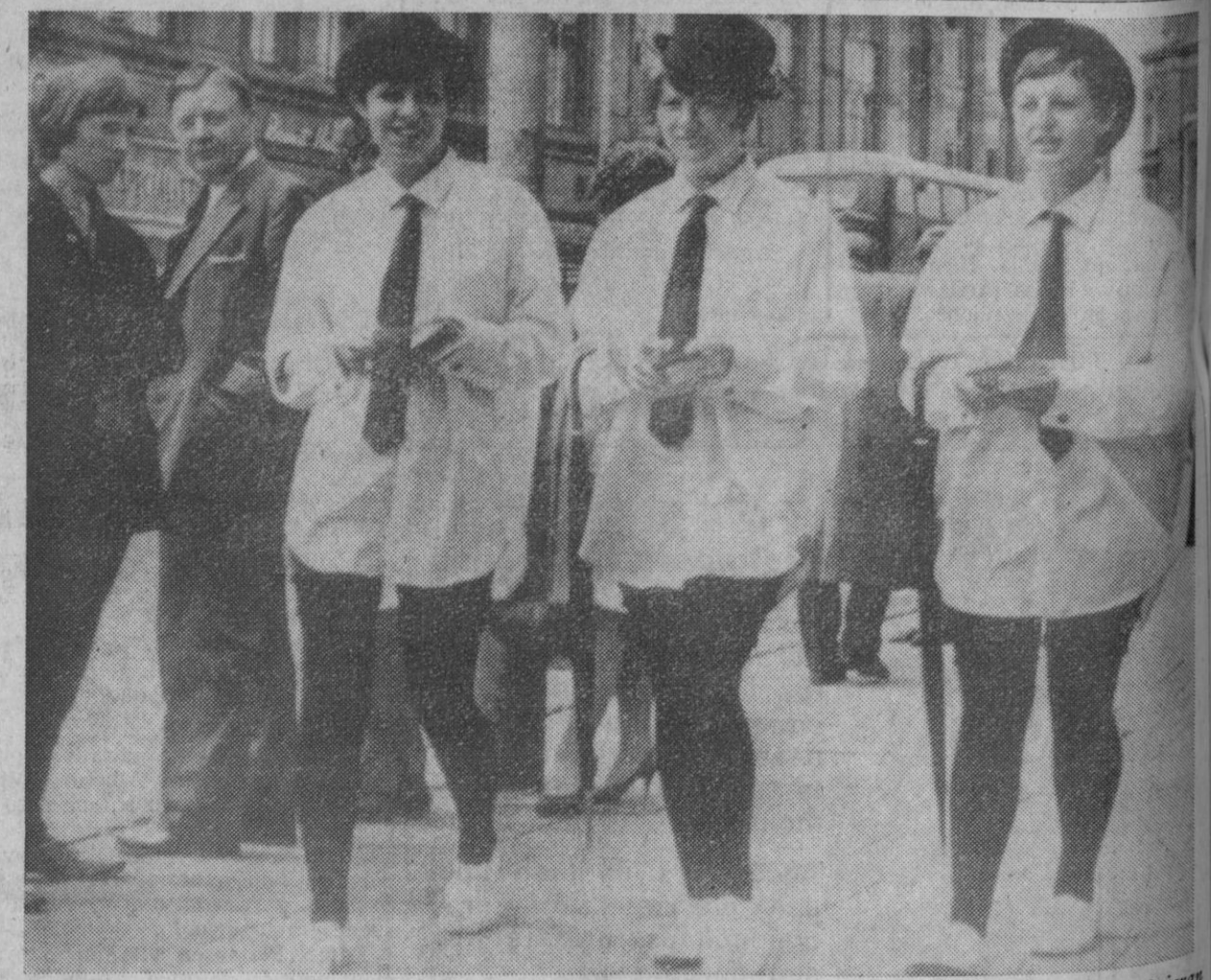
Carlisle (Inglaterra).—Estas tres muchachas salieron a la calle y consiguieron que hasta los ingleses volvieran la cabeza, debido a su aspecto, de auténticos "gentleman" pero en el sexo bello. Como se trata de anunciar un servicio rápido de lavado de camisas, no se han preocupado de los pantalones.

Alicante, 9.—El transatlántico soviético "Taras Shevchenko" llegará el próximo día 17 a este puerto español con buen número de turistas, en cuyo honor, así como de la tripulación del buque, habrá una recepción oficial.—Cifra.