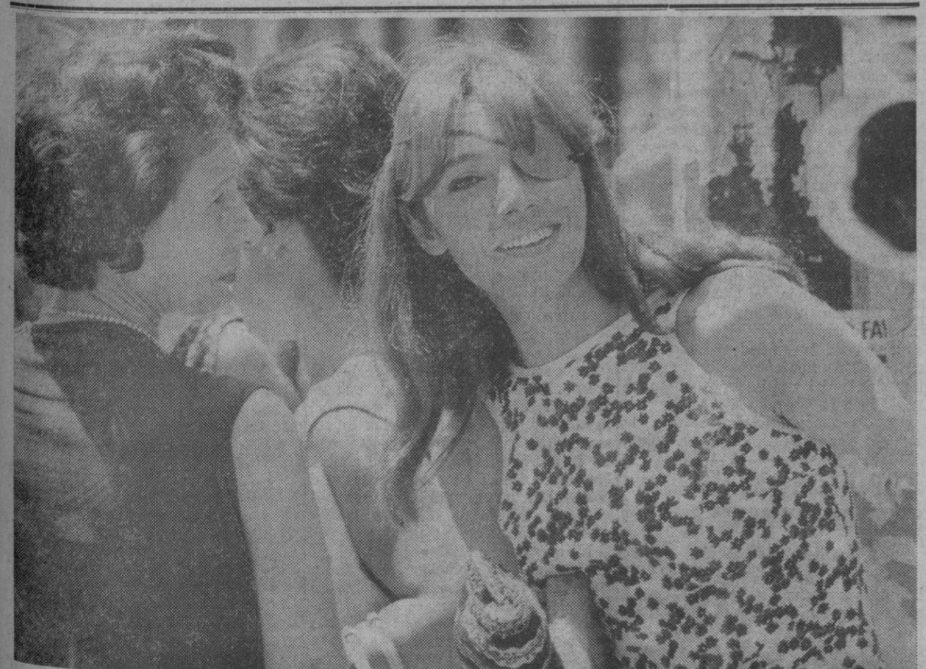
Madrid.—Es posible que si los egipcios hubiesen llegado hasta las fronteras del Líbano, las muchachitas de los Campos Eliseos o de nuestra calle de Serrano—para no ir más lejos—estarían a estas horas llevando "camisitas Nasser" o alargándose la nariz como Cleopatra.

Atenas, 29.—El príncipe Pablo, heredero del trono de Grecia, ha sido bautizado hoy en la catedral de Atenas, mientras la ciudad celebraba el acontecimiento al ser declarado el día festivo.