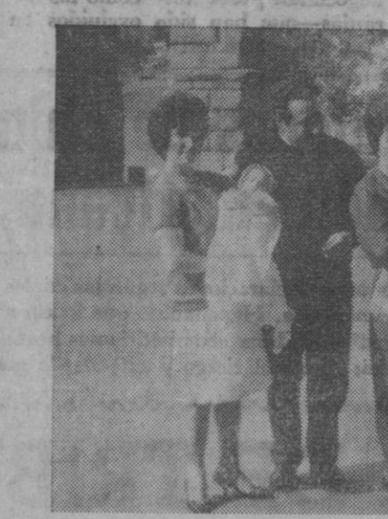
Las trillizas de El Espinar posando para nuestro diario en el Azoguejo. En el centro el feliz matrimonio y a los extremos dos tíos de las pequeñas que, tras ir a ver al médico, se "pasearon" por el Real de Feria, como unas moñitas verbeneras.

Es al padre a quien recabamos nos diga algo de sus pequeñas. Le inquirimos el objeto de este viaje a la capital; complacido, nos responde: