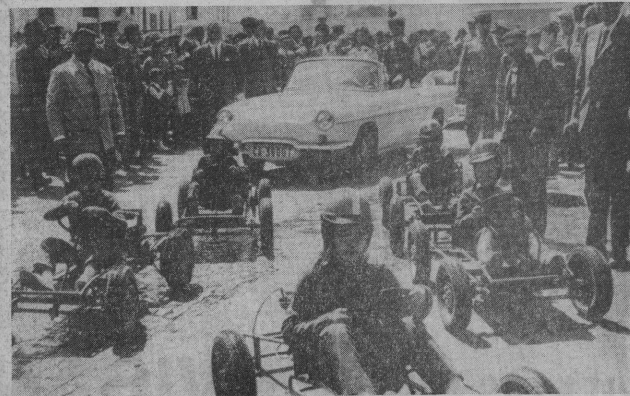
Cádiz.—La reina infantil de las fiestas típicas gaditanas es escoltada por una caravana de chicos en go-karts, a su paso por las calles de Cádiz tras su llegada a la ciudad.

La señora Alliluyeva, que cuenta cuarenta y dos años de edad y que tanto en público como en privado ha reiterado que no desea beneficio alguno por su autobiografía, ha tomado ya medidas para que la mayor parte de sus ingresos sea destinada a organizaciones filantrópicas.—Efe.