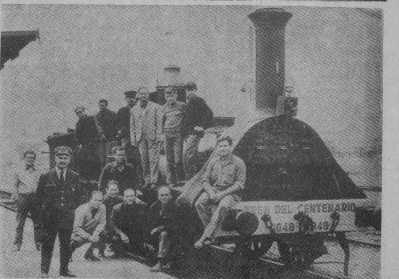
Benicarló (Castellón).—El «Tren del Centenario» que conmemora la llegada a Tortosa del primer tren en 1867, el mismo que celebró la llegada por primera vez a Mataró en 1848, ha estado unos días aparcado y descansando su renqueante paso en Benicarló. Con este motivo los empleados de la Renfe en Benicarló posan para la posteridad.

Milán, 22.—Una carta con veintinueve palabras escrita en Viena sobre un grano de trigo en enero de 1890 y dirigida al alcalde de Milán es una de las muestras que se presentan en la exposición «Curiosidades de Milán» inaugurada ayer en esta ciudad. La exposición ha sido organizada por las Conferencias de San Vicente de Paul. En ella se expone, además, el coche «Isotta Fraschini» de 1902 y el equipaje que portara Alejandro Manzoni. Está también el podium que Toscanini utilizó en Turín para dirigir «Tristán e Isolda» en el año 1897.—Efe.