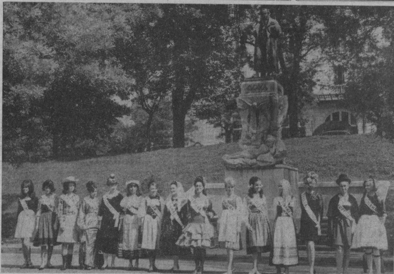
Madrid.—Bajo la estatua de Goya y su «Maja desnuda», a la entrada del Museo del Prado, las participantes de casi todo el mundo que participan en el concurso de belleza «Maja Internacional», con sus trajes típicos y las bandas que identifican su nacionalidad.

Entre los acuerdos remitidos a la superioridad figura el que deben establecerse las condiciones para que dentro de cada Sindicato se formen asociaciones de empresarios, de técnicos y de trabajadores como formas diferenciales y por propia iniciativa de los interesados. Las asociaciones en la proporción que se establezcan nombrarán sus representantes en los consejos nacionales y provinciales para el estudio y gestión representativa de los problemas y asuntos generales comunes a cada una de las citadas categorías.—Cifra.