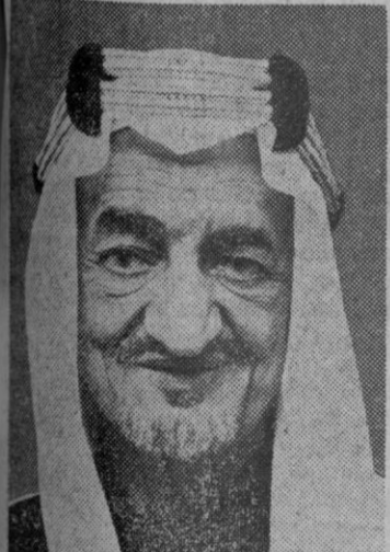
El rey Feisal de Arabia Saudita, quien ha tratado en Londres del futuro estatuto de Arabia del Sur

CORPUS CHRISTI, Día Nacional de Caridad.