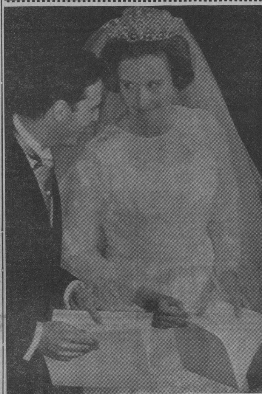
Lisboa.—La infanta doña María del Pilar de Borbón y Borbón y don Luis Gómez-Acebo se sonríen mientras siguen la liturgia de la ceremonia religiosa de su boda en la iglesia del convento de los Jerónimos de Lisboa.