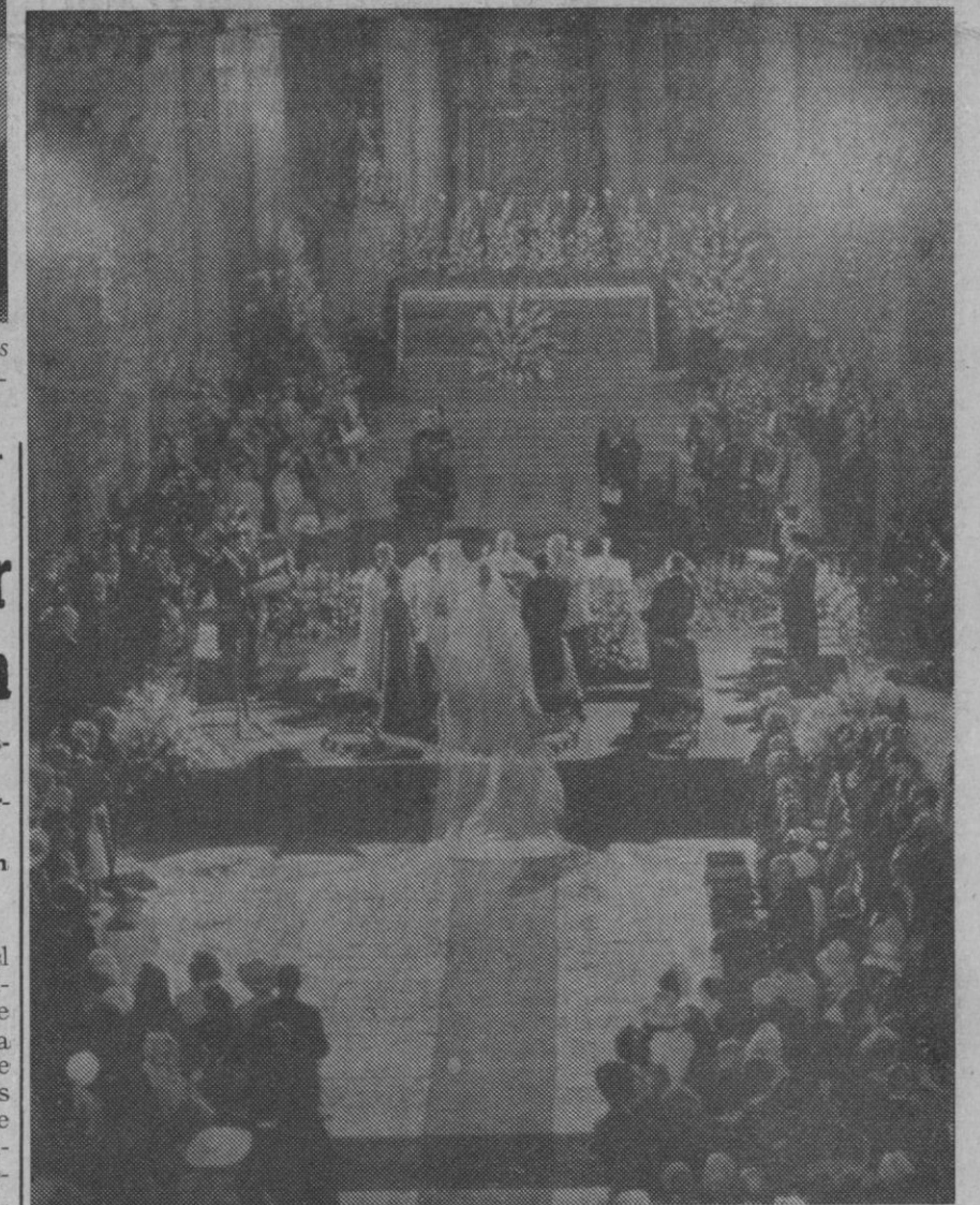
Lisboa.—Interior de la capilla mayor del monasterio de los Jerónimos de Lisboa durante la ceremonia de la boda de la infanta doña María del Pilar de Borbón con don Luis Gómez-Acebo. Al fondo, los invitados reales y familiares. En primer plano, el público que atestaba la iglesia.

Por la meta volante, situada en Castedefells, pasa en primera posición