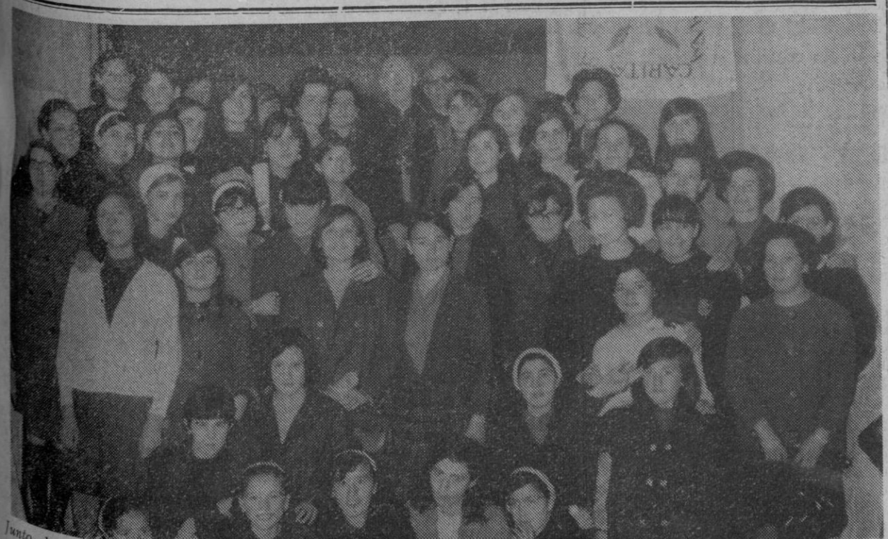
Junto al prelado de la diócesis, que presidió el acto de clausura del curso en la Academia Femenina "Divina Pastora", dependiente de Cáritas Diocesana, se fotografian las alumnas que han seguido el curso, así como las profesoras del mismo.

¡Segoviano! ¡Hombre de bien! Aporta tu donativo a la lucha contra el cáncer