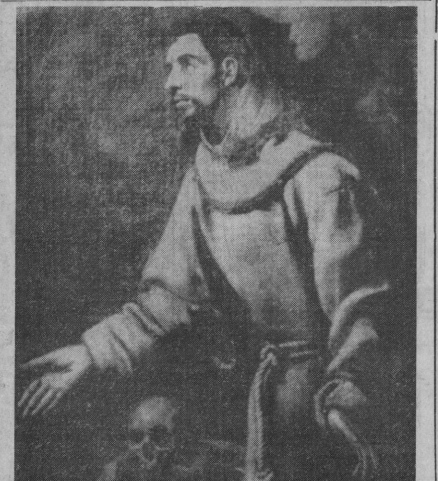
Kosow (Polonia).—Un cuadro desconocido hasta ahora de El Greco el «Exstis de San Francisco» ha sido descubierto en la parroquia de Kosow Laccki a doscientos veinte kilómetros al este de Varsovia. La pintura es propiedad del párroco, reverend Stepan

La ceremonia de investidura se celebrará, probablemente, durante los próximos meses, coincidiendo con una de las visitas del ilustre científico a su villa natal.