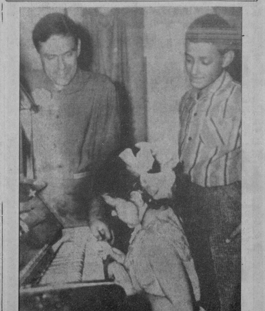
El cosmonauta soviético coronel Vladimir Komarov, con su hijo Zhenya y su hija Irina, al piano. La foto fue hecha en octubre de 1964 antes de la primera misión espacial de Komarov.

Londres, 25.—Dos grandes sistemas de tráfico, controlados por sendos computadores, serán suministrados por la firma británica «Elliot Automation Company» para las ciudades de Madrid y Barcelona. El pedido, por valor de más de 500.000 libras esterlinas (90 millones de pesetas) fue formalizado por las autoridades españolas después de estudios intensivos de los sistemas de tráfico en ciudades de todo el mundo. El sistema destinado a Madrid —capital reconocida por los técnicos como una de las de tráfico más densas en toda Europa— abarcará el centro de la ciudad, controlando más de 117 intersecciones. En el de Barcelona controlará 108 intersecciones, también en el centro.—Efe.