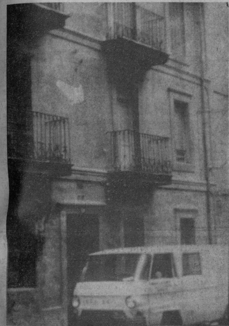
Bilbao.—En las dos ventanas (derecha) de esta casa de la calle de Zaballa, 18, en Baracaldo, está el piso en el que la policía ha descubierto multicopistas, máquinas de escribir, clichés y publicaciones comunistas soviéticas y chinas utilizadas en su propaganda ilegal y subversiva, sobre todo entre las Comisiones Obreras, los seis miembros detenidos de la llamada «Oposición Sindical Obrera de Euzkadi».