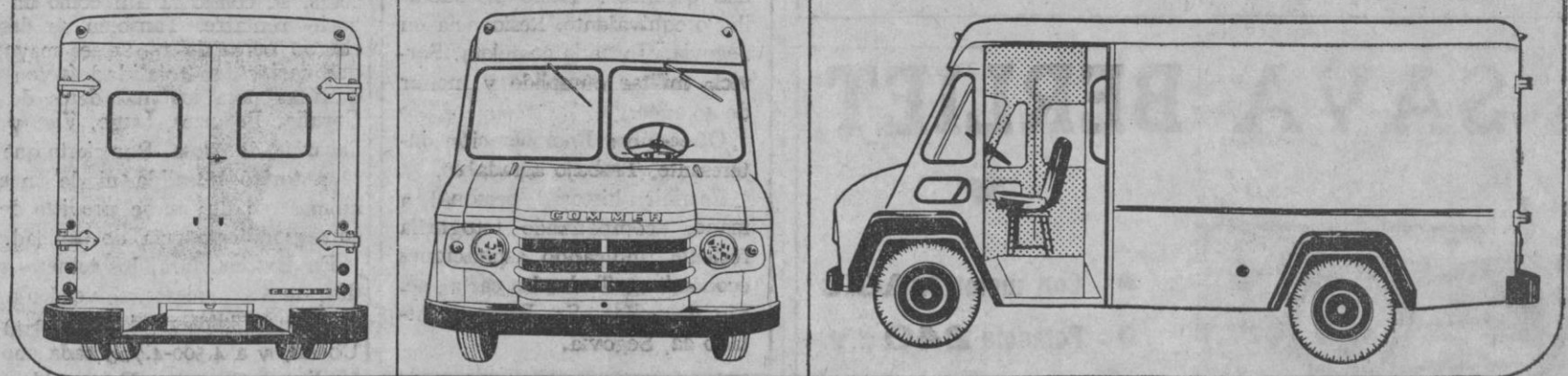
(Diseño actual de máxima funcionalidad que permite la utilización plena del espacio)

EL FURGON MAS FUNCIONAL del mercado. Línea moderna, de amplias superficies rectas que facilita el total aprovechamiento de sus 10,13 m 3 de capacidad real.