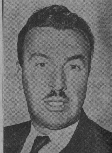
Adam C. Powell, célebre político de color que la cámara de Representantes de Estados Unidos ha destituido de sus funciones como miembro del Congreso americano

Sería la tercera fuerza política del país