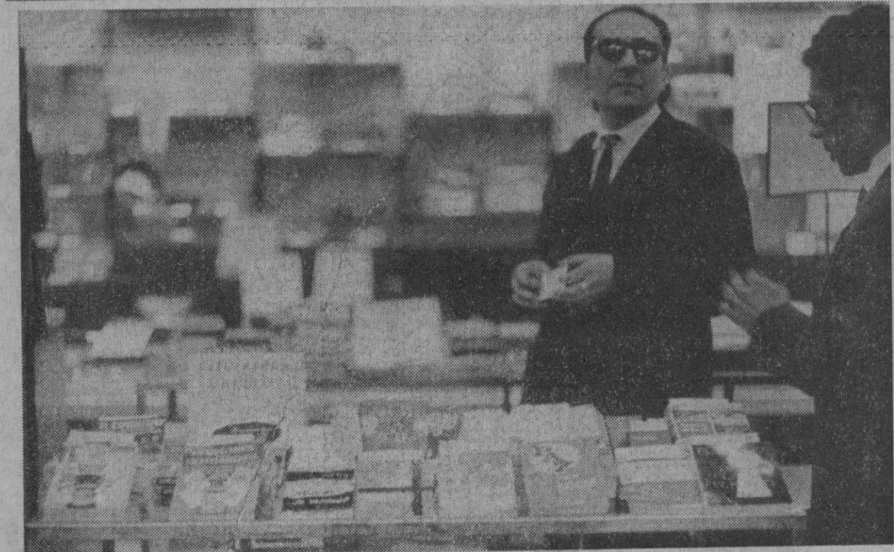
Madrid.—Biblias y otros libros religiosos de llamativas portadas se venden en un puesto de las galerías de unos céntricos almacenes madrileños. Un cartel dice: «Literatura Evangélica». Se trata de literatura de la Iglesia Evangélica española. El proyecto de libertad religiosa, entre tanto, se encuentra pendiente de ser sometido a las Cortes Españolas.

Los mismos círculos informan que el proyecto del nuevo reglamento, que se pretende sustituya al recientemente aprobado por la autoridad correspondiente y que no ha merecido el beneplácito de los Colegios Provinciales, sea elevado a la mayor brevedad a la Dirección General de Sanidad para su aprobación.—Cifra.