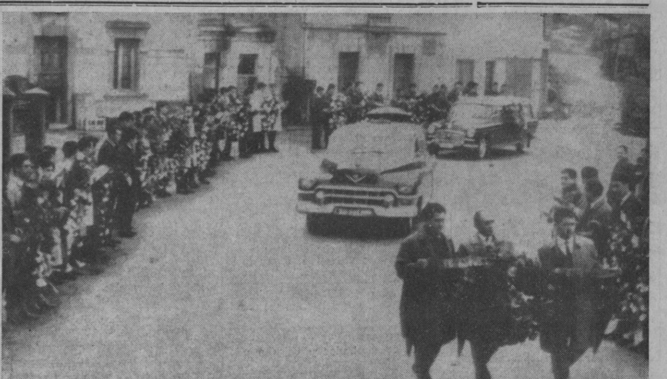
Riosa (Asturias).—Entre coronas de flores marcha el cortejo fúnebre de los cuatro mineros muertos en Minas de Riosa a consecuencia del accidente provocado por una fuga de agua.

Naciones Unidas (Nueva York), 31.—El Subcomité de Peticiones del Comité Especial de los 24, sobre la extinción del colonialismo, ha postergado, en espera de más amplia información, la circulación de ocho comunicaciones recibidas, entre ellas una sobre Gibraltar y otra sobre el Sahara Español.