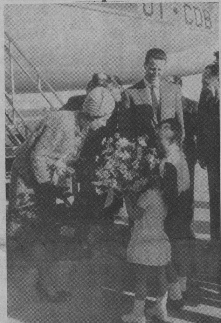
Sevilla.—Un hijo del cónsul belga en la capital sevillana ofrece un ramo de flores a la Reina Fabiola al descender del avión a su llegada a Sevilla. Tras ella, el Rey Balduino. Recibieron a los Soberanos el jefe de la Región Aérea del Estrecho. Los Soberanos belgas se trasladaron a continuación a la finca de "San Calixto", donde pasarán las vacaciones de Semana Santa.

Córdoba, 18.—Los Reyes de Bélgica han oído misa en la capilla existente en la finca de San Calixto, en el término de Hornachuelos, donde pasan una temporada de descanso.