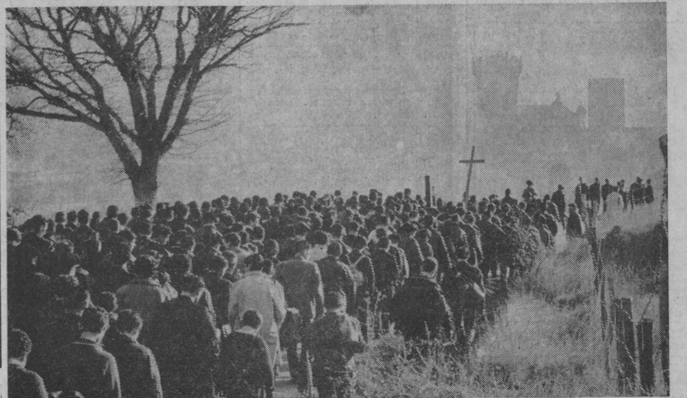
Javier (Navarra).—Una larga e interminable fila de peregrinos de todas las edades y procedencias, y de ambos sexos llega al Castillo de Javier, en la tradicional «javierada» para ganar la Novena de la Gracia del Santo.

Según fuentes bien informadas se afirma que Svetlana llegó a Beatenberg el sábado pasado y que ha salido de esta localidad esta mañana temprano en dirección desconocida, ya que empezaba a ser conocida.—Efe.