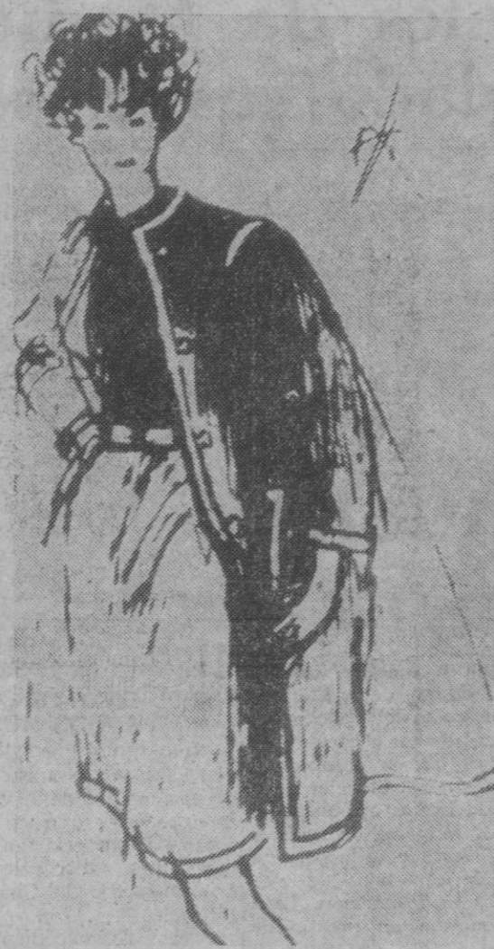
He aquí un vestido, en forma de campana, diseñado por Balmain. Nótese el estrecho cinturón de cuero.

Lo que importará en 1967 no será el aspecto