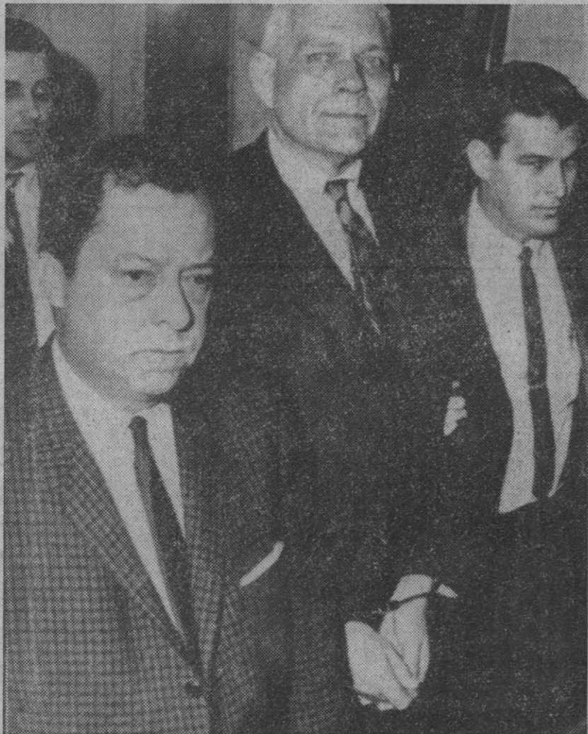
Nueva Orleans.—Clay Shaw, en el centro, abandona la oficina del fiscal de distrito de Nueva Orleans esposado y escoltado por la policía, tras haber sido detenido en relación con lo que el fiscal llama "conspiración para asesinar al presidente Kennedy". La detención de Shaw, el miércoles, es la primera llevada a cabo desde que se reveló la investigación.

Madrid, 2.—Sarita Montiel, de verdadero nombre Antonia Abad Fernández, ha presentado una demanda laboral por incumplimiento de contrato contra el productor cinematográfico don Cesáreo González Rodríguez. La demanda, en la que solicita una indemnización de veinticuatro millones de pesetas, ha correspondido por reparto a la Magistratura de Trabajo número 6. Se trata de la reclamación individual más cuantiosa que se ha tramitado ante la jurisdicción laboral madrileña.—Cifra.