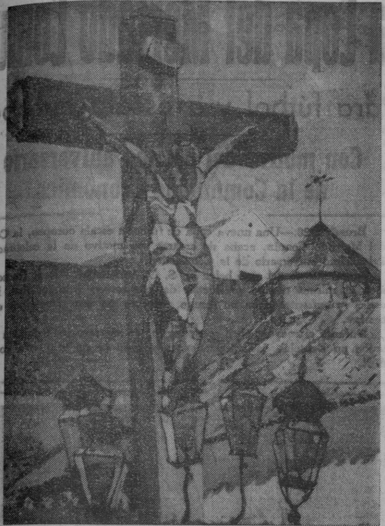
Las obras de Pedro Mañen, que se exponen en la sala de la Obra Cultural de la Caja de Ahorros, están causando la admiración de cuantos visitan esta interesante muestra. Mañen "concibe el cuadro como la unidad superior a la que todo se subordina", ha escrito Enrique Lafuente Ferrari, ilustre crítico de arte. "Pinta por masas añejas; con energía y sutileza, utiliza