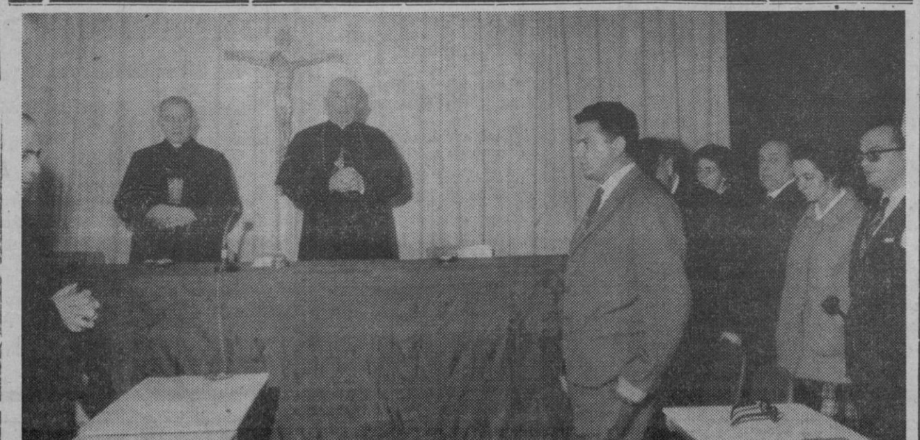
Madrid.—Seis seculares de ambos sexos, dirigentes de Acción Católica y de las Congregaciones Marianas (derecha) rezando juntos con los demás miembros de la Conferencia Episcopal Española al comenzar la IV Asamblea en la Casa de Ejercicios del Pinar de Chamartín. En la presidencia, el cardenal-arzobispo de Santiago de Compostela, Quiroga Palacios, presidente de la Conferencia, y el cardenal-arzobispo de Tarragona, Arriba y Castro.

Hamburgo, 28.—Un tribunal de Hamburgo ha rechazado las pretensiones de Anna Anderson, de sesenta y cinco años de edad —quien afirmaba ser la hija del último zar ruso— y de esta forma a los derechos que le pudieran corresponder a la fortuna de la casa Romanoff.—Efe-Reuter.