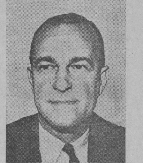
Richard Helms, jefe de la C.I.A. americana, objeto ahora de vivas críticas a causa de las ayudas económicas que la organización ha concedido a ciertas organizaciones

Las citadas conclusiones serán elevadas al ministro secretario general del Movimiento. Asistió también a la reunión el vicesecretario nacional de Ordenación Económica, que actuó como presidente acompañado de otras jerarquías nacionales.—Cifra.