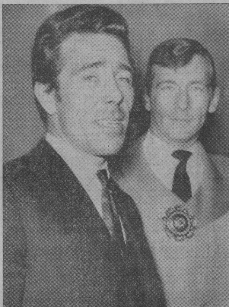
Nueva York.—Lord Snowdon, sale del Forum de los 12 Césares, en Nueva York, en un club nocturno, el pasado lunes. El mismo día había negado rumores de una separación entre él y la princesa Margarita. Detrás de él se ve al portero del Forum.

Vigo, 28.—La esposa del Jefe del Estado, doña Carmen Polo de Franco, acompañada de su hija, la marquesa de Villaverde, y del ministro de Marina, almirante don Pedro Nieto Antúnez, ha presidido esta mañana, en Vigo, el acto de bendición del buque pesquero congelador «Mar de Vigo», de 3.000 toneladas de registro bruto, que viene a ser el mayor construido en España y uno de los más importantes que existen actualmente en el mundo. Doña Carmen Polo de Franco actuó de madrina del nuevo barco.