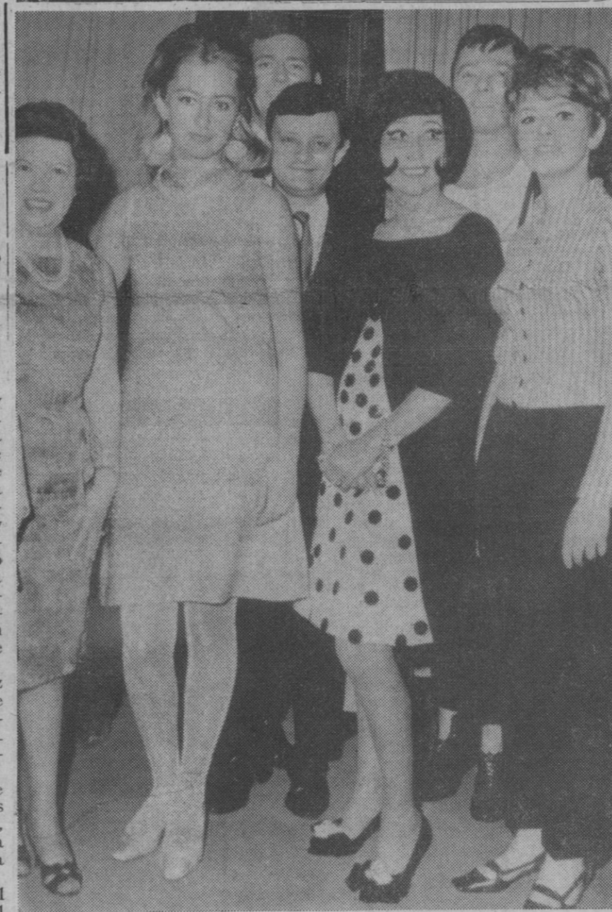
Bruselas.—La princesa Paola de Lieja ha sido fotografiada con este modelo de minifalda durante la espera de la función en un teatro de Bruselas. Es su primera presentación en público vistiendo la moderna pieza, realizada en seda plateada con zapatos y medias a juego.

Finalmente, el ministro de trabajo don Jesús Romeo Gorria, pronunció un discurso.—Cifra.