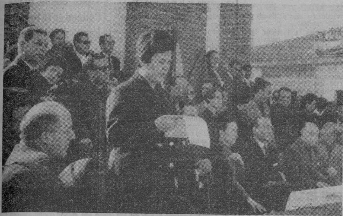
Todas las Cátedras tienen un acto final que resulta muy brillante y en el que se lee la Memoria de actuaciones

Las cifras reseñadas, acreditan un esfuerzo común, coordinado y serio. Es bien cierto que las cifras, si a dinero se refieren, despiertan una expectación singular, pues no en vano nuestros tiempos están signados por la encroscacia, la renta «per cápita», el «seis coma siete», y un sin fin de eufemismos; pero hay valores trascendentes, esenciales, que encuentran su fomento en la limpia y silenciosa tarea de la Sección Femenina que con su abnegación y humildad nos da ejemplo a todos.—J. P.