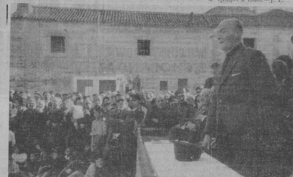
El gobernador civil haciendo uso de la palabra en una de las clausuras de la Cátedra Ambulante

jante en Nava de la Asunción. El resumen de los asistentes a las cátedras de Escarabajosa, Mozoncillo, Fuentepeyayo, Turégano, Yanguas de Eresma, Villaverde de Is-