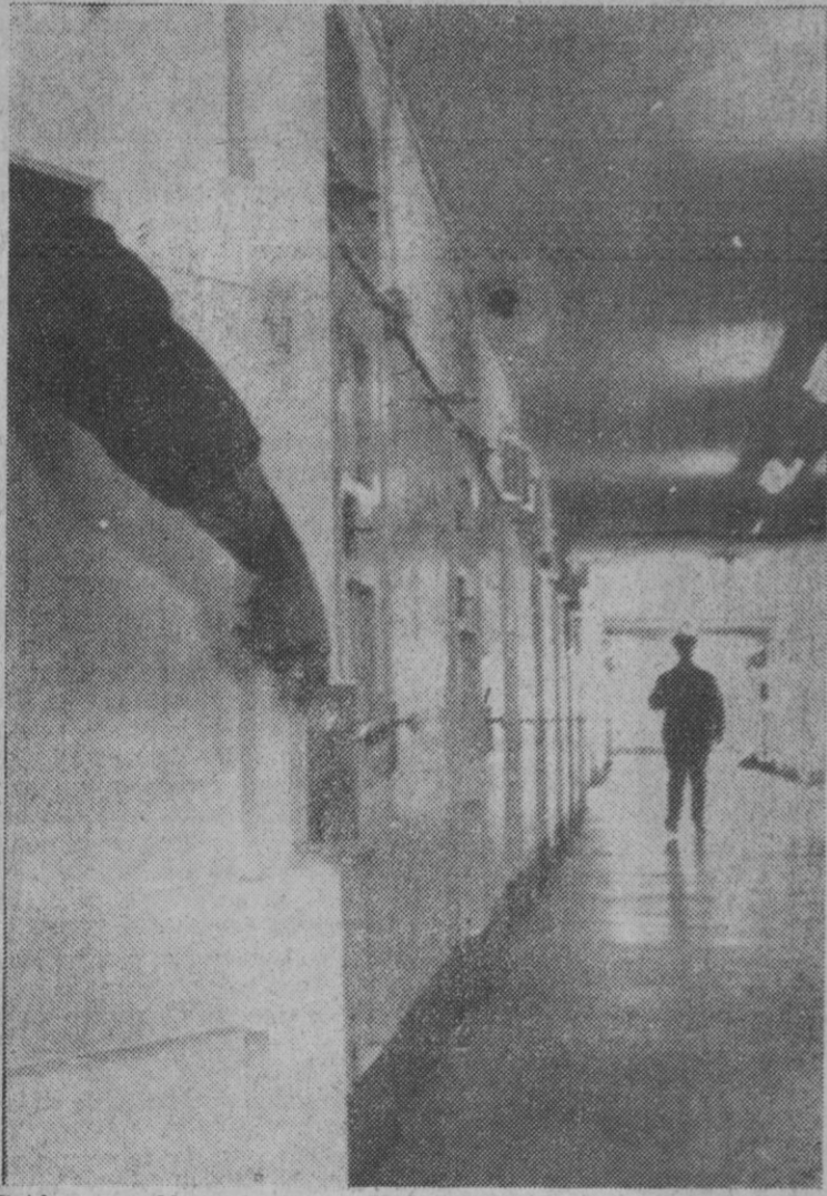
Bridgwater (Massachusetts).—Un oficial de la policía hace una demostración práctica del modo como Albert Desalvo consiguió sacar el brazo por la ventanilla de su celda y escapar después de abrir el cerrojo exterior.—(Telefoto AP-Europa Press)

Nueva York, 26.—El «estrangulador de Boston», Albert H. Desalvo—después de disfrutar de treinta horas de libertad relativa—, se ha entregado ayer a la policía al verse descubierto cuando se encontraba en una tienda de uniformes de policía, sita en la pequeña localidad de Lynn, en el estado de Massachusetts a unos setenta kilómetros al norte del hospital mental Bridgwater, de donde se escapó en la madrugada del viernes y donde se halla recluido en espera de ser trasladado a prisión para cumplir cadena perpetua, que le fue impuesta en el juicio celebrado en enero, y en el que se le acusó de robos y asaltos sexuales a cuatro mujeres.