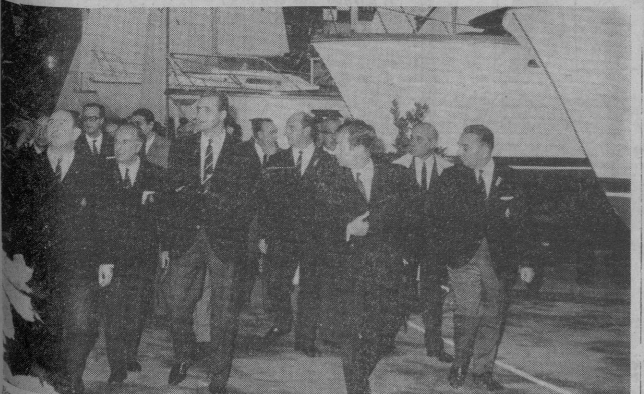
Barcelona.—El príncipe Juan Carlos ha visitado el V Salón Náutico Internacional. Le han acompañado en su visita el gobernador civil, el delegado nacional de Educación Física y Deportes, y los directores del Salón.

Madrid, 25.—Salió esta mañana de Madrid, en dirección a Bruselas, para incorporarse a su puesto, el embajador de España ante la Comunidad Económica Europea, don Alberto Ullastres.—Cifra.