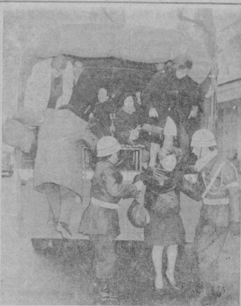
París.—Dos soldados ayudan a una mujer a descender de un camión militar, suscitando a los autobuses como consecuencia de la huelga de transportes en París.

Roma, 2.—Los cigarrillos que había fumado Nikolai Podgorny, presidente de la Unión Soviética, durante la entrevista con Pablo VI, han provocado una polémica entre varios diarios italianos. «Paese Sera», vespertino comunista de Roma, informó ayer que «por primera vez en la historia una persona había fumado delante del Pontífice». La persona era Podgorny. Esta tarde, el diario «Il Giornale d'Italia», vespertino de centro, informa en primera página que el dirigente comunista «no fumó en su conferencia con Pablo VI» y rechaza, en forma rotunda, la noticia de su colega. Este aspecto anecdótico ha sido el único tema sobre el cual se ocuparon los dos diarios.—Efe.