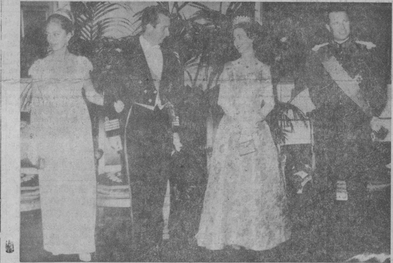
Bruselas.—Los Reyes de Bélgica y los príncipes de Lieja poco antes del almuerzo ofrecido al cuerpo diplomático al que asistieron todos los miembros del Gobierno.

Índice general de la sesión: 100,46 frente a 100.—Cifra.