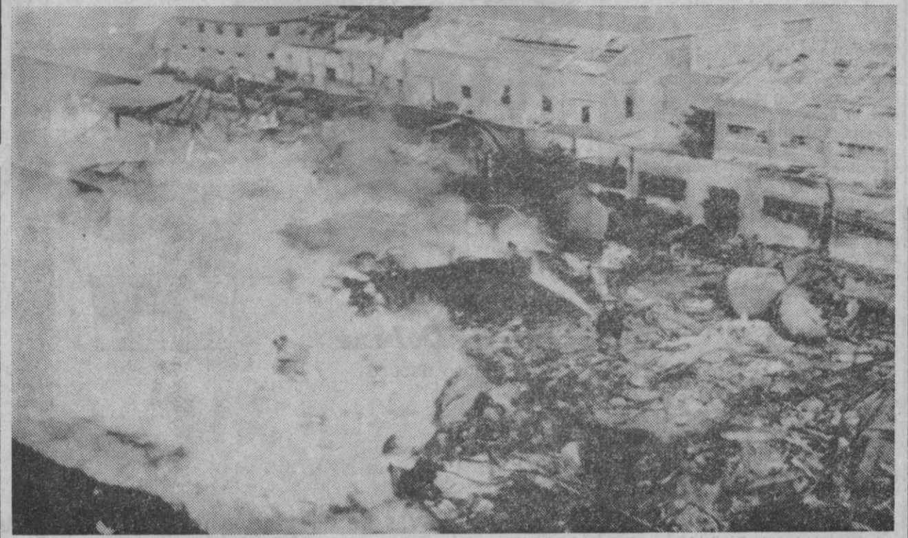
Santurce.—Aspecto general que presenta hoy el siniestro que se produjo en las instalaciones de la CAMPSA, en Santurce. Aun no se puede calcular el número de millones de pérdidas que ha producido el siniestro.