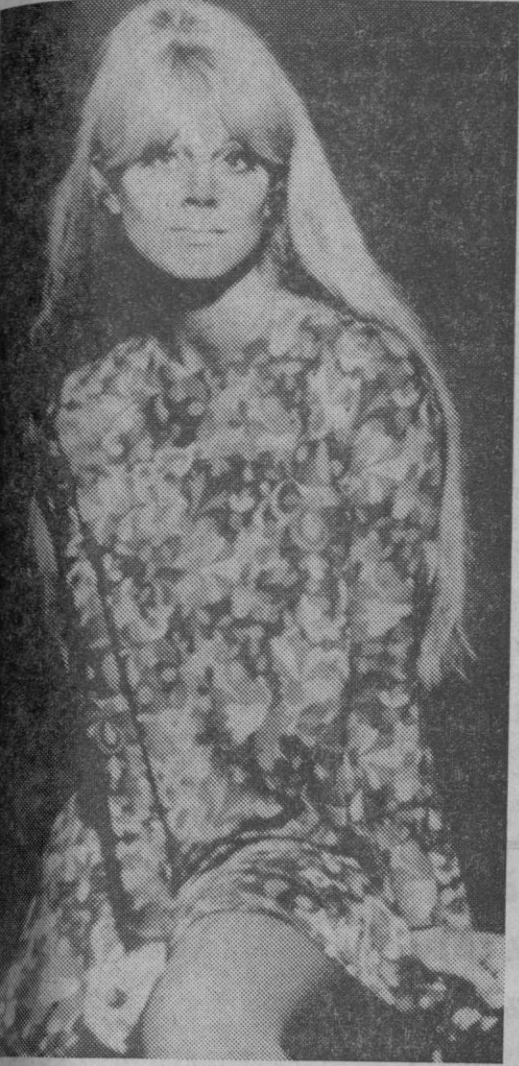
La nueva Mandy, madre de dos niños y modelo.