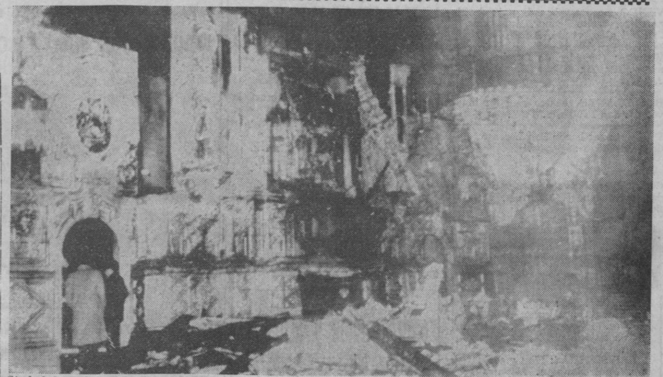
Ciudad de Méjico.—El altar de la Misericordia de la catedral metropolitana de Méjico destruido por un incendio producido el martes por la noche, que produjo graves daños a varias obras de arte. Se cree que la causa del incendio fue un cortocircuito

Bonn, 19.— El observatorio de la Universidad de esta ciudad recibirá el radiotelescopio más grande del mundo, que es financiado por la firma automovilística alemana «Volkswagen» y cuyo planeado espejo parabólico va a ser aumentado hasta un diámetro de 100 metros.—Efe.