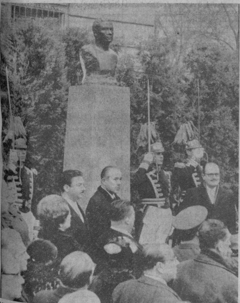
Madrid.—El alcalde de Madrid, señor Arias Navarro, y el embajador de Nicaragua, don Vicente Urcuyo, después de descubrir un busto de Rubén Darío en la plaza que lleva el nombre de éste con motivo de cumplirse el centenario del nacimiento del famoso poeta.

Almería, 19.— Continúa detenida en esta ciudad, a disposición del tribunal de Orden Público, la duquesa de Medina-Sidonia. Se tiene la impresión en los medios competentes que de un momento a otro se recibirá una orden telegráfica en relación con la duquesa, si bien se ignora si se dispondrá quede en libertad o sea trasladada a Madrid.—Cifra.