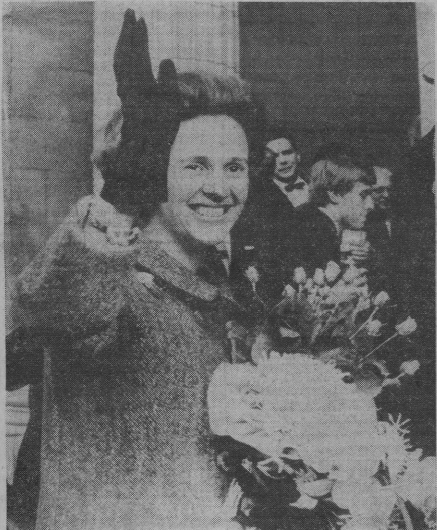
Gante (Bélgica).—La reina Fabiola de Bélgica responde a las aclamaciones del público al llegar al museo de Bellas Artes de Gante donde visitó la Exposición de El Greco.