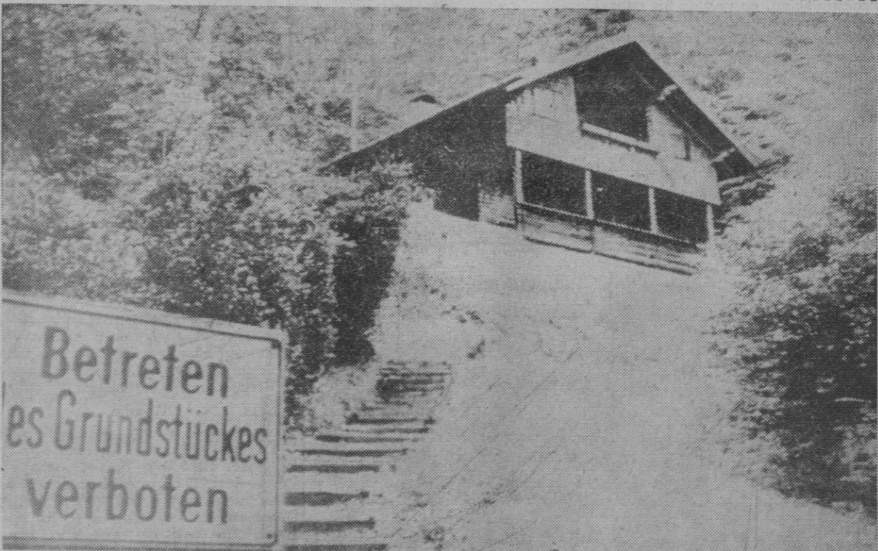
Walchense (Baviera).—Bungalow donde el ex-jefe de las Juventudes Hitlerianas, Baldur Von Schirach, vivió después de salir de la prisión de Spandau, cumplida la condena de veinte años dictada por el tribunal de Nuremberg el uno de octubre de mil novecientos cuarenta y seis. El cartel dice: "Prohibida la entrada a este lugar".

Las mil personas han perdido la vida en la ciudad de Jacmel, en la costa suroeste de Haití. También se registran cien muertos en Puerto Príncipe, donde dos hospitales quedaron totalmente destruidos.