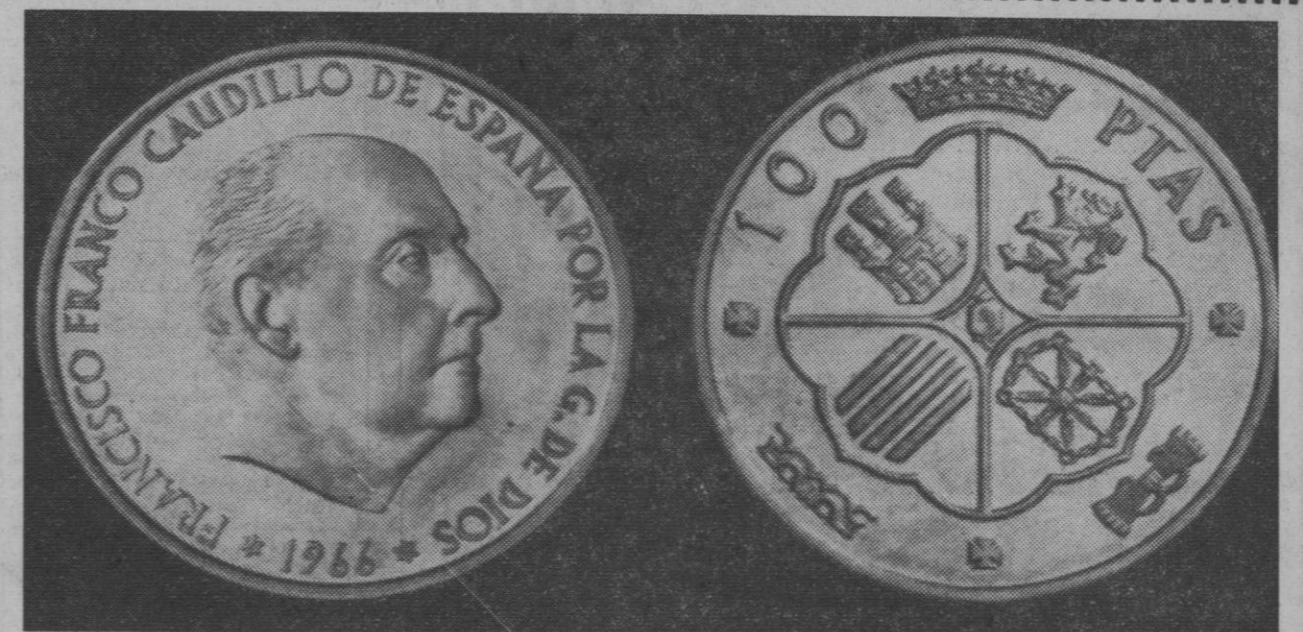
He aquí el anverso y reverso de las monedas de plata de cien pesetas que han sido puestas en circulación el día 1 de octubre, coincidiendo con el trigésimo aniversario de la elevación de Francisco Franco a la Jefatura del Estado. La cantidad puesta en circulación ha sido de veinticinco millones, y han sido utilizadas mil toneladas de plata para acuñar las nuevas monedas.

gurado el Congreso y pronunció unas palabras de bienvenida a los asistentes, en las que expresó su esperanza de que las conclusiones que se obtengan abran nuevos caminos para elevar mundialmente la ganadería y con ello el progreso y el desarrollo de los pueblos.