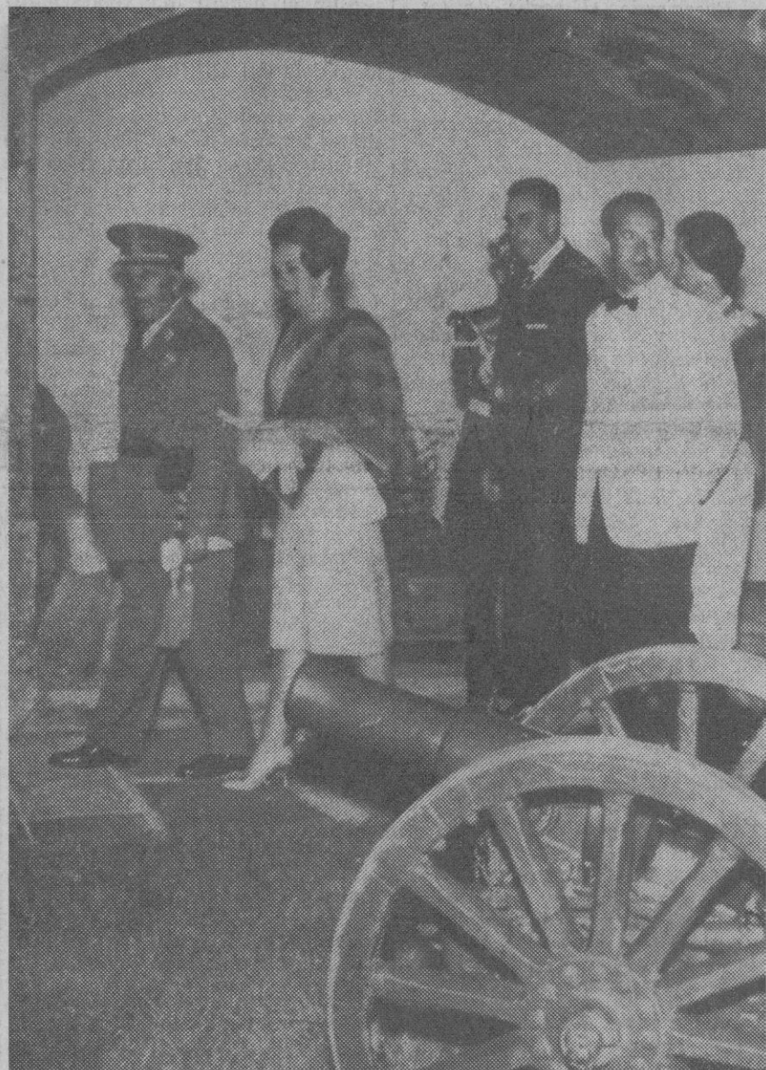
La Coruña.—S. E. el jefe del Estado, acompañado de su esposa, miembros del Gobierno, el alcalde de La Coruña y miembros de la corporación municipal, presenciaron en el castillo de San Antón, emplazado a la entrada de la bahía, una sesión de juegos artísticos, siendo después obsequiados con una cena fría. La foto muestra al Caudillo y su esposa, acompañados del alcalde y su esposa, a su llegada a la antigua fortaleza.

«El resultado de toda esta carrera de armas sería indefectiblemente la autoderrota, que costaría billones de rublos o de dólares y el número de bajas, en caso de guerra nuclear, sería enorme», terminó diciendo Fisher.—Efe-Reuters.