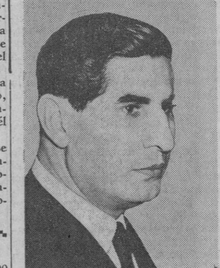
Nagy Taleb, el nuevo hombre fuerte del Irak, donde ha formado un nuevo Gobierno

Miranda de Ebro, Alicante 53.795.-Jerez de la Frontera. CON 30.000 PESETAS 29.733.-Barcelona. 44.751.-Mieres. 56.820.-Murcia. 39.572.-Madrid, Vigo, Lérida, Gijón, Barcelona, Las Palmas. 2.132.-Vinaroz, Madrid, Calatayud, Barcelona, Murcia, Córdoba, Bilbao, Palma de Mallorca. 13.378.-Alicante, Madrid, Alcalá de Henares, Manacor. 9.741.-Lucena, S. Sebastián, Eibar. 35.925.-Palma de Mallorca. 24.494.-Arcos de la Frontera, Villanueva y Geltrú, La Unión, Mieres, Madrid, Barcelona, Bilbao, Puertollano. 31.887.-Nava del Rey, Avilés, Barcelona, Sevilla, Málaga, San Sebastián, Cádiz. 22.037.-Arcos de Jalón, Zaragoza, Loja, Vélez-Málaga, Sevilla, Palma de Mallorca. 11.288.-Valencia. 43.863.-Alicante. 15.435.-Madrid, Oviedo, Granada, Getafe, Barcelona, Las Palmas. 57.091.-Oviedo.—Cifra.