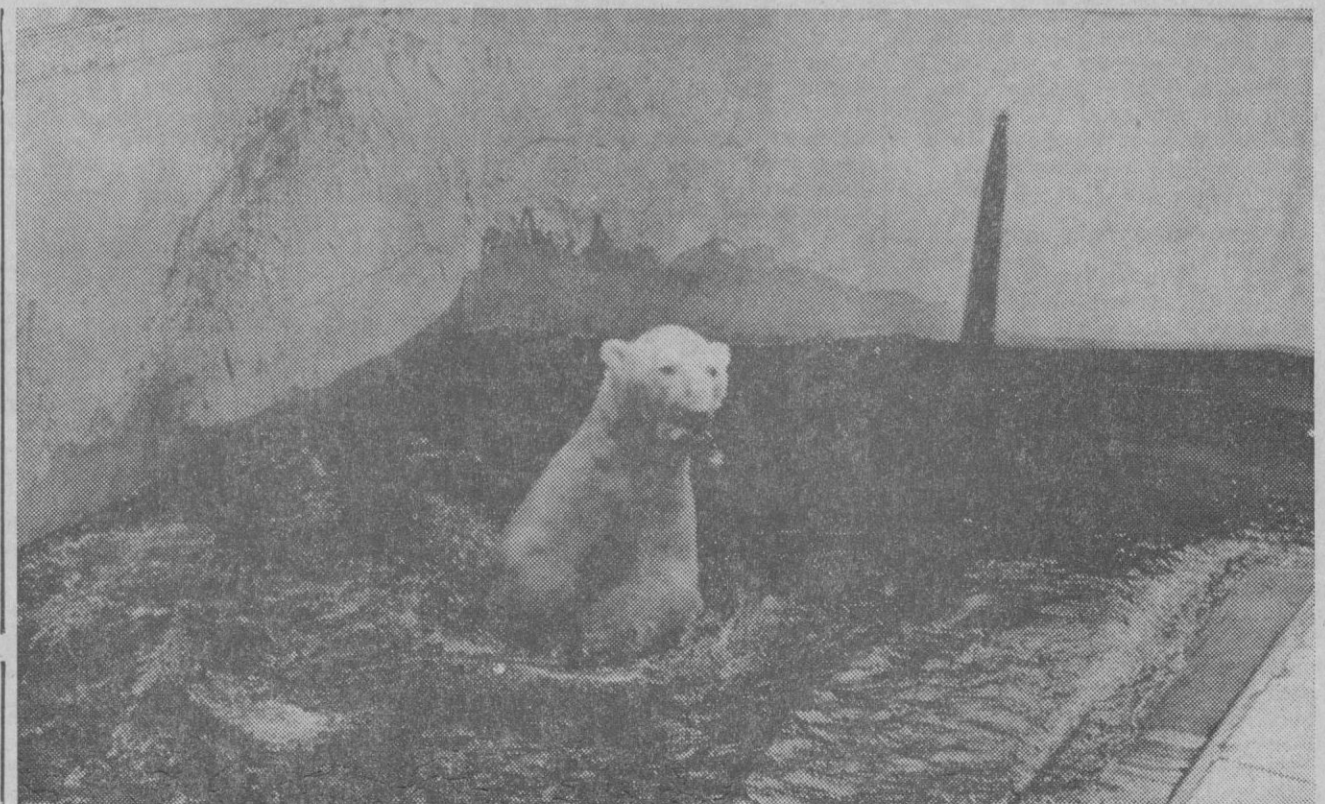
El hermano oso no tiene problemas con el calor. En cuanto se siente sofocado se da un baño en su piscina particular y aquí no ha pasado nada.

—Cada animal vale una fortuna. Hay algunos, como las jirafas, que