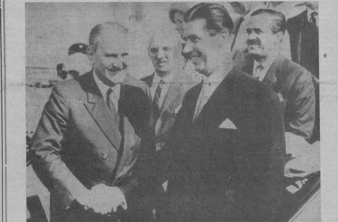
Viena.—El ministro español, señor Castiella, saluda a su colega austriaco doctor Lujo Toncic-Sorinj que acudió a recibirle al aeropuerto vienés.

Sacramento (California), 6.—Dos negros resultaron muertos anoche, en el barrio oeste de Sacramento, a causa de los disparos efectuados por tres hombres blancos desde un automóvil, informa la Policía. Las víctimas murieron a causa de las heridas al llegar al hospital. Han sido detenidos tres sospechosos en las cercanías de la comunidad de Bryte.—Efe-Upi.