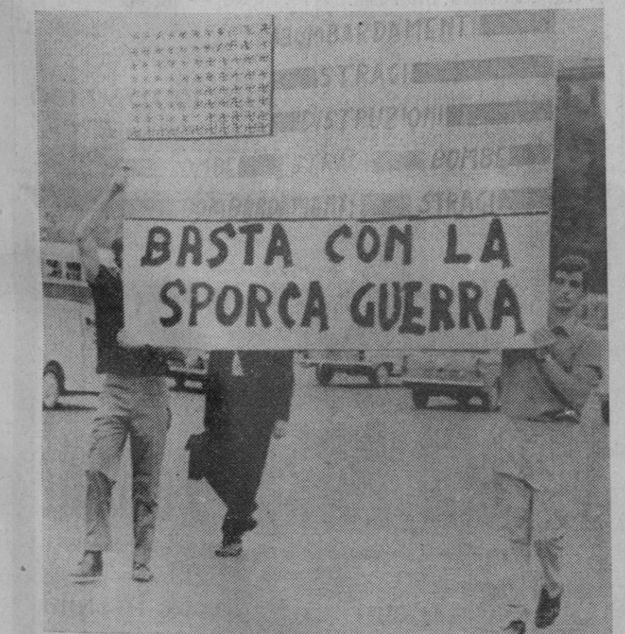
Roma.—“Basta con la sucia guerra”, dice esta pancarta que muestra la bandera americana con las estrellas sustituidas por cruces nazis. La pancarta fue confiscada por la policía durante un intento de manifestación ante la Embajada norteamericana en Roma.—(Telefoto AP-Euroopa Press)

El italiano Albonetti ha ganado la quinta etapa del Tour del Porvenir. El italiano Hill conserva el jersey amarillo de líder.