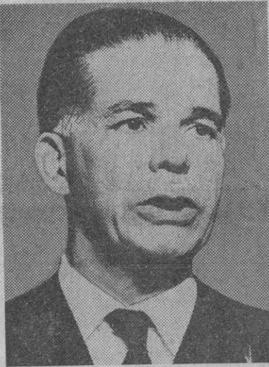
Joaquín Balaguer, elegido presidente de la República Dominicana, con una victoria sorprendente sobre su candidato oponente Juan Bosch a quien se consideraba favorito

Parma (Italia), 13.—Los italianos Gimondi y Adorni y sus compañeros del equipo «Salvarani» han comunicado que no participarán en el Tour francés.—.