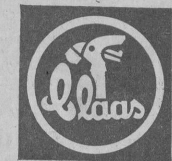
1.ª marca europea

DOBLE Frigoríficos FAGOR AHORRO ¡Fagorícese usted! Al comprarlo Al usarlo J. HORCAJO, S. A.