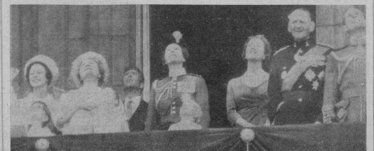
Los miembros de la Casa Real inglesa, mirando hacia el cielo en el momento en que pasan los aviones de la RAF sobre el palacio de Buckingham, durante la parada militar celebrada con motivo del cumpleaños de la Reina Isabel