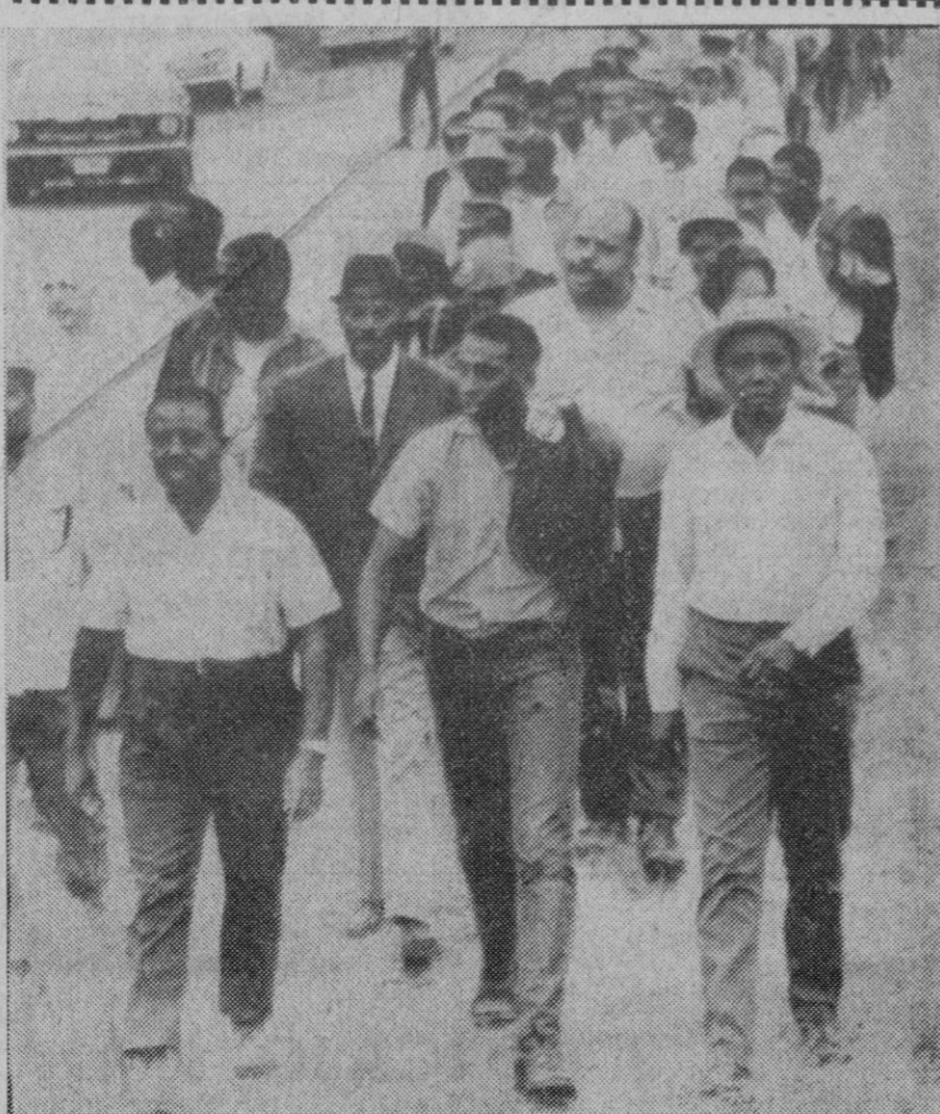
Stokely Carmichael (centro), líder del Comité Coordinador de No Violencia, y Floyd McKissick, director nacional del Congreso de Igualdad Racial, marchan al frente de la marcha Memphis-Jackson, en el sexto día de la caminata pro derechos civiles en EE. UU.

Los estudiantes, que protestaban por el asesinato de cubanos en la base de Guantánamo gritaban: «Cuba, sí; yanquis, no», mientras se dirigían, en compactos grupos, hacia el centro de la ciudad. La policía efectuó varias detenciones.—Efe.