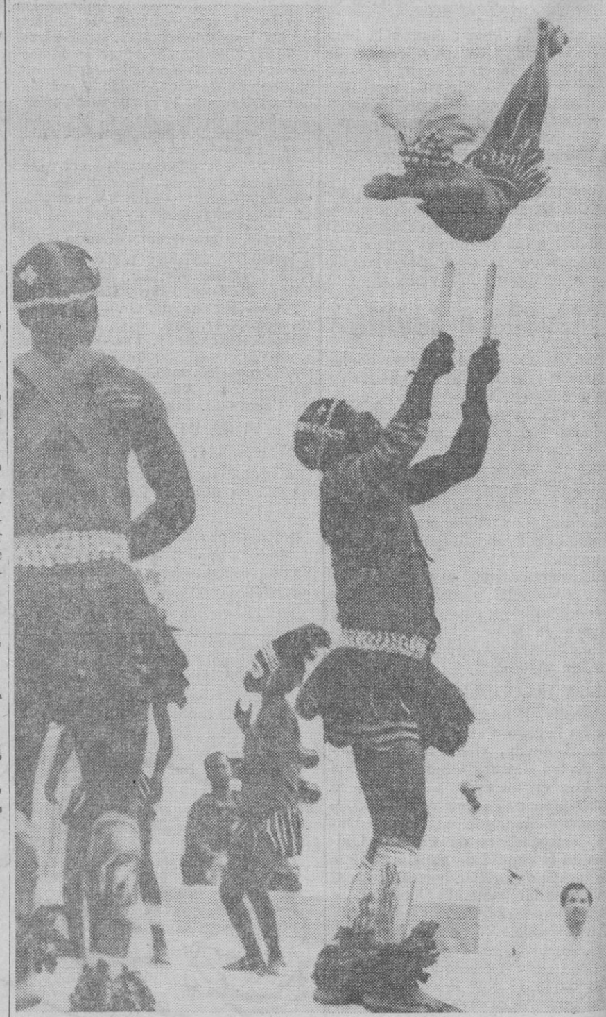
Esta es la "Danza de los Cuchillos", que presentan bailarines de la delegación de Costa de Marfil, durante el I Festival de Artes Negras que se celebra estos días en Dakar.

Evans anunció, al mismo tiempo, que va a ser constituido un ejército secreto en Gales, inspirado en la I. R. A.—el ejército republicano irlandés—. Un portavoz del Ministerio del Interior ha pretendido quitar importancia a las declaraciones de Evans diciendo: «Nadie ha oído hablar de ese ejército.»—Efe.