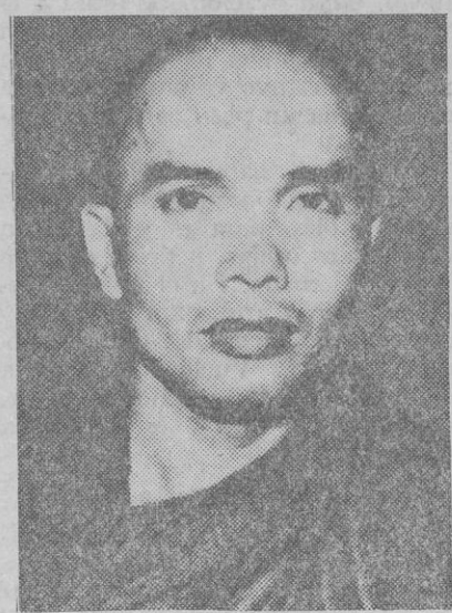
Thich Tri Quang, poderoso cabecilla budista en la lucha que esta confesión sostiene contra el Gobierno de Saigón, dirigido por Cao Ky

Singapur, 17.—La agencia oficial de noticias del Vietnam del Norte dio cuenta hoy de que aviones norteamericanos bombardearon una zona suburbana de la capital norvietnamita, Hanoi. La expresada fuente añadió en su parte al respecto que el mando del ejército norvietnamita ha enviado una nota de enérgica y urgente protesta a la Comisión Internacional de Control en el Vietnam, contra el ataque realizado sobre ese arrabal de Hanoi, así como contra los hechos de los bombardeos por parte de aeronaves de los Estados Unidos sobre la ciudad de Phu-Ly y zonas de la provincia de Hai-Duong.