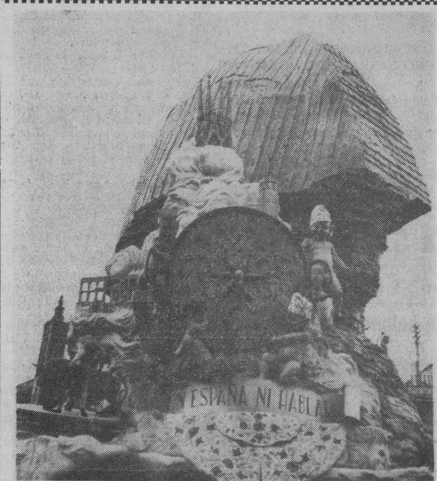
El acueducto segoviano figuró en una de las fallas quemadas el pasado día de San José, en Valencia. Era la falla dedicada al turismo, que se instaló en la plaza del Convento de Jerusalén y que obtuvo el segundo premio. En su base, a la izquierda de la fotografía, puede apreciarse claramente parte de la reproducción del acueducto.

Mediante una nota al Gobierno de la República francesa, de ponderado pero firme contenido, el Gobierno de los Estados Unidos calificó al Memorandum galo del 11 de marzo de «no preciso», y agrega que espera ulterior aclaración.