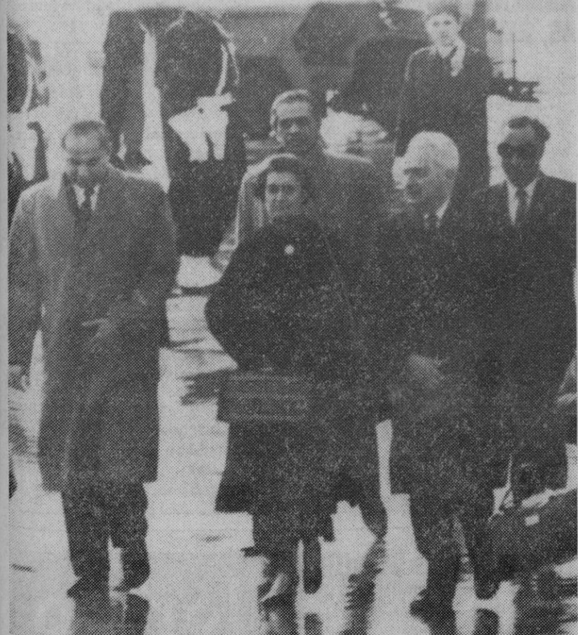
La primera ministra de la India, Indira Gandhi, en el momento de llegar al aeropuerto de Orly, en París, para celebrar conversaciones con el Gobierno francés. El embajador de los Estados Unidos en Francia, Charles Bohlen, acudió a recibirla con el ministro francés de Estado, Louis Joxe (a la derecha).—Foto AP-Europa

La Fuerza Aérea constituyó una sección especial denominada «Proyecto Libro Azul» la cual ha investigado 10.147 noticias de «ufos», desde comienzos de 1947. La Fuerza Aérea dice que 646 de los testimonios de haber visto tales objetos no han tenido explicación. Los otros casos se han atribuido a causas astronómicas, aviones, globos, misiles, y en algunos casos, como alucinaciones y otros fenómenos psicológicos.—Efe.