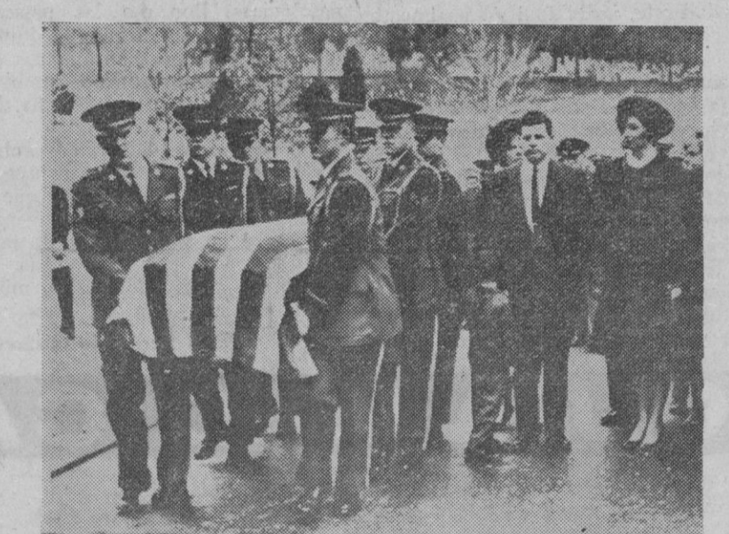
Washington.—Entierro del comandante Charles A. Basset, en el Cementerio Nacional de Arlington. El astronauta pereció el 28 de febrero en un accidente de aviación. Aparece la viuda y su hijo, Peter, de cuatro años.

Yakarta, 8.—Más de tres mil estudiantes se manifestaron a gritos pidiendo la dimisión del doctor Subandrio e invadieron el Ministerio de Asuntos Exteriores a pesar de emplearse gases lacrimógenos y hacerse disparos para intimidar por las tropas de la guardia.