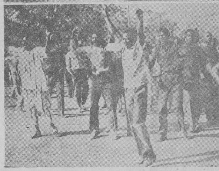
Alto Volta.—He aquí un aspecto de los manifestantes con motivo del golpe de estado militar llevado a cabo por el coronel Lamizana, que depuso al presidente Yameogo.