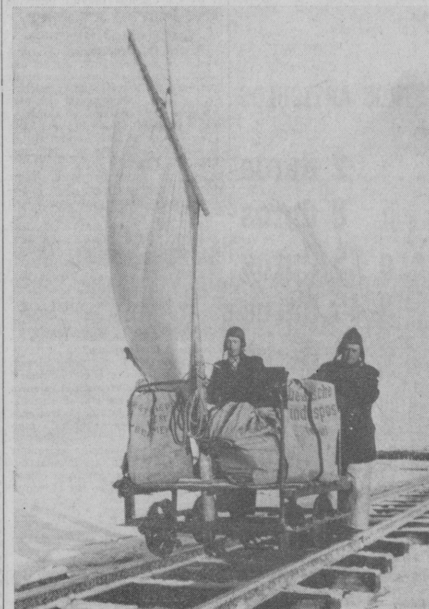
El invierno obliga muchas veces a hallar nuevas soluciones. La estación fría origina muchas dificultades, en primer lugar para los habitantes de la costa del Mar del Norte, porque el hielo amenaza encerrar por completo muchas islas por no ser ya posible alcanzarlas por medio de barcos. El Correo en cambio, no omite ningún esfuerzo para no interrumpir el servicio postal entre la tierra firme y las islas. El «ferrocarril de vela» disfruta del viento para transportar con pocos gastos y con relativa velocidad las pesadas valijas a sus solitarios lugares de destino

Lincoln (Inglaterra), 8.—Un perro collie, llamado «Dinkie» luce desde hoy un diente de oro. El animal se rompió recientemente uno de sus dientes delanteros y el percance ha sido reparado ahora por un dentista de Lincoln que ha cobrado por su trabajo tres mil trescientas sesenta pesetas.—Efe.