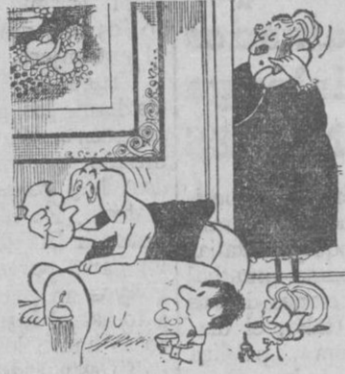
—Como podrá oír, doctor, tenemos un enfermo en casa...

Casa Solera. Distribuidor de BUTANO, S. A.