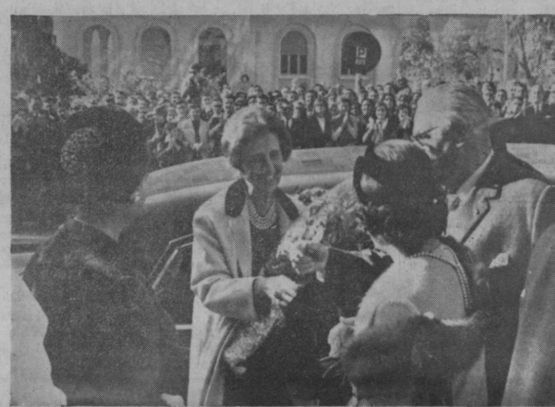
Alicante.—Estuvo en esta ciudad en visita privada, la esposa de S. E. el Jefe del Estado, doña Carmen Polo de Franco, la cual fue recibida por el gobernador civil. Visitó diversas factorías alicantinas y continuó viaje a Murcia.—(Foto Europa Press)

Munich (Alemania occidental), 1.—El primer avión a reacción de transporte del mundo que despega y aterriza verticalmente, ha salido de los hangares de una fábrica local, para ser exhibido ante funcionarios de Defensa de la Alemania occidental. El aparato, cuyo peso es de veinte toneladas, lleva motores británicos "Pegasus" de la Bristol Siddeley y Rolls Royce "RB 162". Ha sido bautizado con el nombre de "Do-31-E-1" y es el mayor aparato construido por una fábrica alemana desde que terminó la pasada guerra mundial. Puede transportar una carga equivalente a seis toneladas.—Efe.